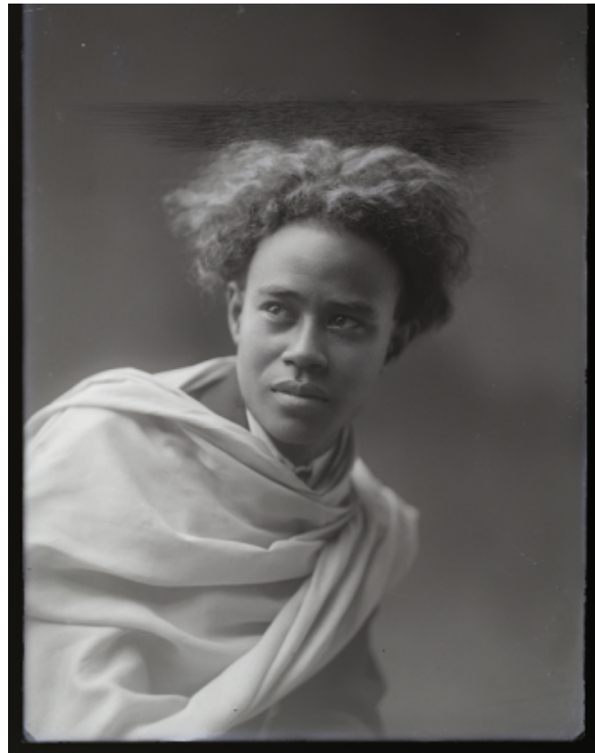
Fig. 2 : Portrait de Rabearivelo par Ramilijaona.