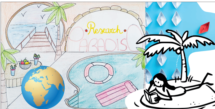
Figure 2. Planche concept du Research Paradiso

Le concept de Research Paradiso (« recherche en environnement paradisiaque », voir figure 2) propose de laisser au scientifique la liberté de construire son propre environnement et son propre parcours de recherche. Affranchi des contraintes sociales, géographiques et temporelles, le chercheur (ou tout autre acteur de la recherche) pourrait ainsi explorer de nouvelles voies d'inspiration et les renouveler. Le but ici est de créer un écosystème de recherche personnalisé et favorable à l'expression de la créativité. Cet écosystème favorable s'appuierait sur deux leviers : un levier externe consistant à construire un environnement extérieur favorable à une défixation (par exemple, « Le havre de paix » décrit par Silvia [2019]) ; et un levier interne consistant à autoriser une organisation compatible avec son mode de vie personnel et sa propre écologie fonctionnelle (par exemple « Le chercheur polymorphe »). Le concept Research Paradiso vise trois éléments caractérisant un climat de créativité : la liberté d'action, le temps disponible pour créer et un environnement ludique, enjoué, libéré des enjeux de manière temporaire.