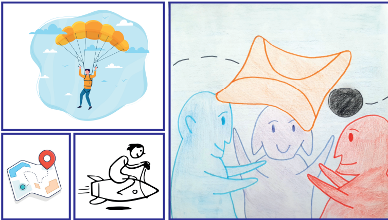
Figure 3. Planche concept du Wingsuit Research

l'échec, non pas pour lui-même, mais pour le progrès dont il porte la graine. Le concept favorise de ce fait une perception plus positive du risque, encourageant à plus d'audace. Au lieu de redouter le risque et ses potentielles conséquences négatives, le chercheur y verra davantage d'opportunités de stimuler sa créativité et de capitaliser sur ses éventuelles erreurs. Les actions associées au concept de Wingsuit Research ciblent trois facteurs cognitifs favorisant la créativité : la perception du risque (et en conséquence la prise de risque), le sentiment de confiance dans le climat ou l'environnement de travail, et le sentiment d'appui de ses idées par autrui dans son environnement de travail (Moultrie et Young, 2009).