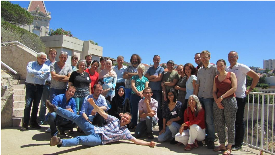
Photographie 1. Les participants de l'atelier