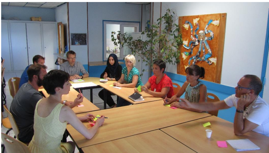
Photographie 3. Travaux en groupes restreints : Café découverte