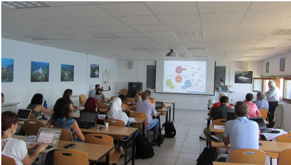
Photographie 2. Communications en plénière