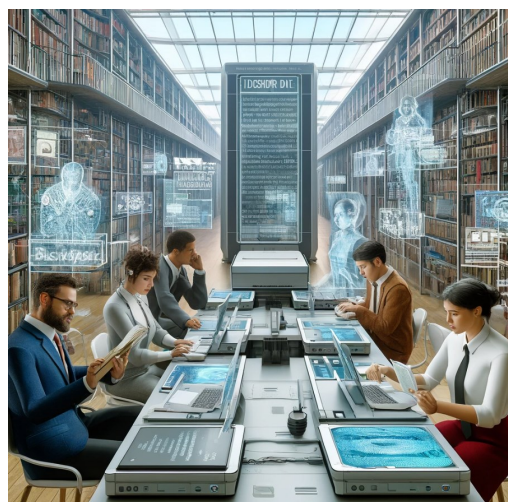
Image générée par l'outil Dall-e à partir du titre de cette chronique

L'auteur : Oui mais là il s'agit d'un problème d'hallucination qui n'est pas lié à la qualité et au format de l'image puisque tu l'as corrigée sans que je te redonne une nouvelle image.