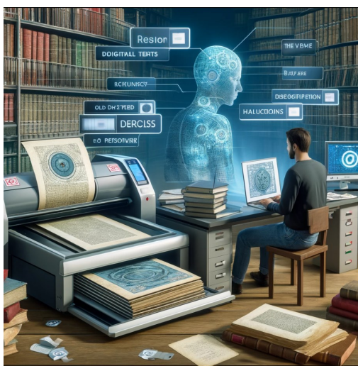
Image générée par l'outil Dall-e à partir du titre de cette chronique

SM-OCR : Très bien, nous procéderons de cette manière pour toutes vos futures demandes de transcription. N'hésitez pas à télécharger vos prochaines images ou à me faire part de tout autre besoin. Je suis ici pour vous aider avec la plus grande précision possible. Bonne continuation dans votre analyse lexicale ! (...)