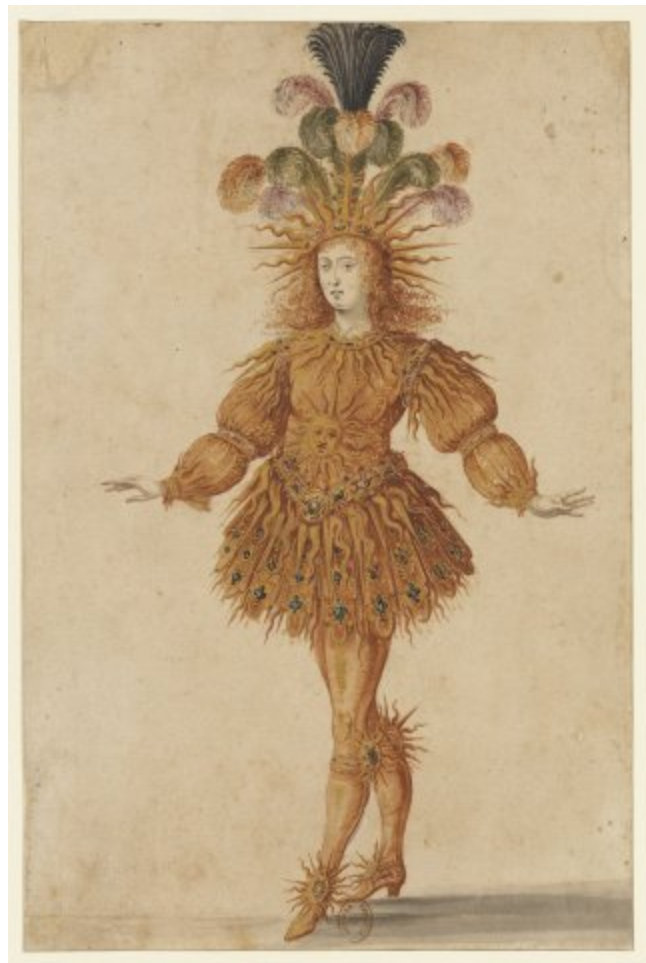
Costume du Soleil Levant (Versailles, Ballet royal de la nuit)

L'enrôlement de la danse au service d'une orthopédie sociale est une tradition ancienne, qui remonte en effet à la Grèce des philosophes. Dans les Lois , Platon vante les mérites de la choreia ( Lois 654b ), les danses chorales qui accompagnent les rites de la cité, et dans lesquelles la communauté citoyenne reconnaît son unité. Platon voit dans le règlement orchestrique des figures corporelles, spatiales et oratoires ( skhèmata ), une « écriture des corps » où se marquent les vertus cardinales de la cité. À l'inverse, les danses dionysiaques, et leurs trances sans mesure ni figures, représentent à ses yeux un danger d'anomie sociale.