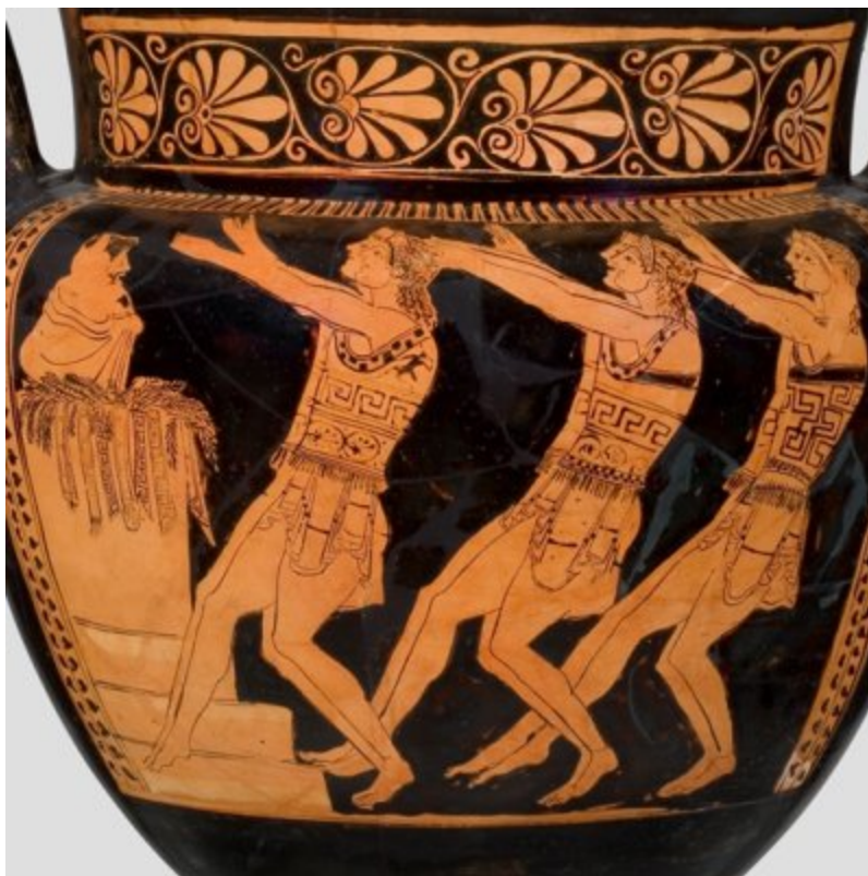
Cratère avec une scène de théâtre (Danseurs devant un autel de Dionysos) - Manière de Myson