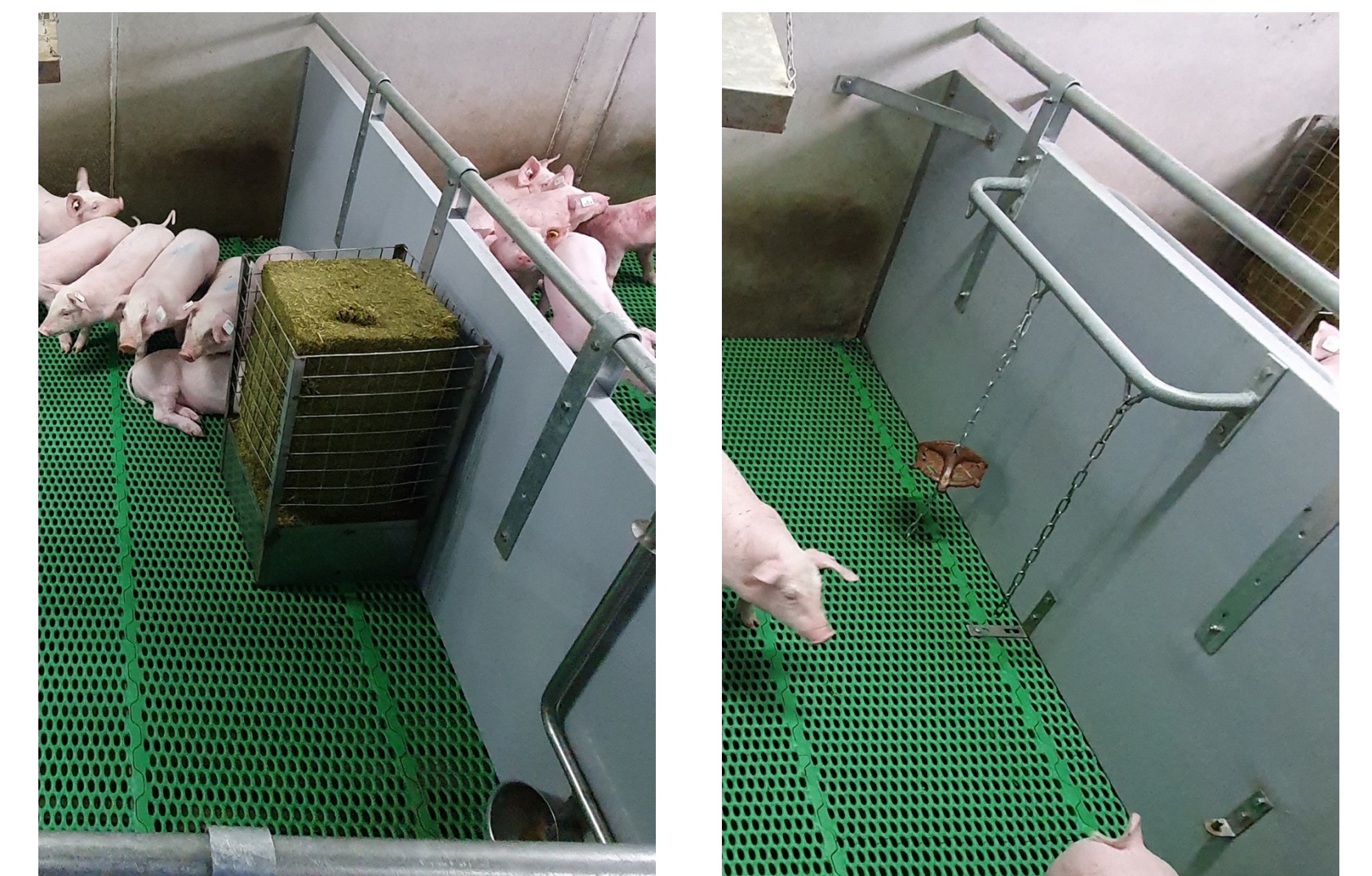
Figure 1 : Part de comportement d'investigation