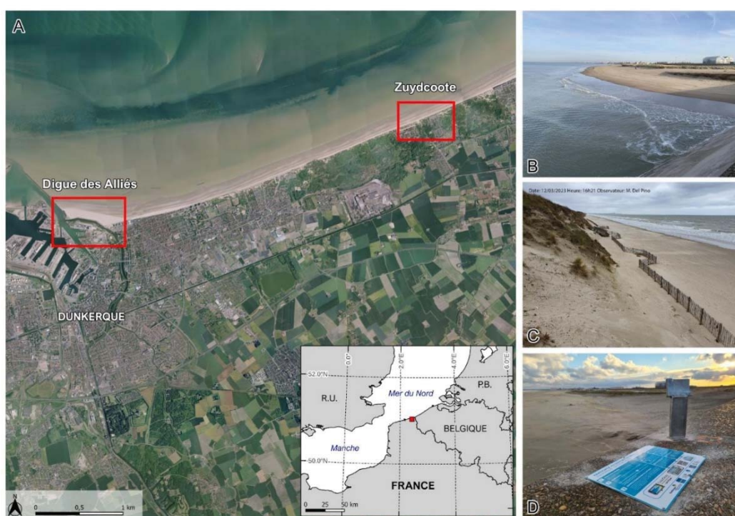
Figure 1. A : Localisation des sites d'étude ; B : Station CoastSnap de la digue des Alliés ; C : Station CoastSnap de Zuydcoote ; D : Exemple de socle en inox et de panneau informatif.

second site est situé sur le front de mer de Zuydcoote (Figure 1C) et est orienté en direction de l'Ouest de manière à pouvoir observer les variations de la position du trait de côte de la dune Dewulf, qui montre une tendance au recul de du trait de côte récemment ralentie par les aménagements de protection du pied de dune. La station CoastSnap de Zuydcoote vise entre autres à mettre en lumière l'impact des installations de casiers de ganivelles installés en pied de dune.