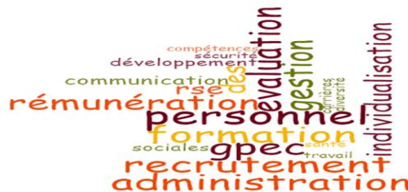
Figure 3 : Nuage de mots