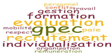
Figure 2 : Nuage de mots