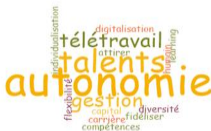
Figure 1 : Nuage de mots