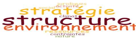
Figure 5 : Nuage de mots