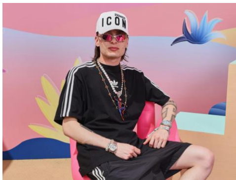
Figure 2 - Peso Pluma à la Coachella Valley Music & Arts Festival, 2023 | YouTube Shorts Content Studio à l'Empire Polo Club le 14 avril 2023 à Indio, Californie.

Figure emblématique de corridos tumbados et de la scène musicale mexicaine, Peso Pluma , de son nom complet Hassan Emilio Kabande , est né à Jalisco au Mexique en 1999.