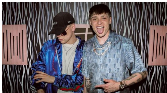
Figure 3 - Peso Pluma et Bizarrap le 31 mai 2023 au Mexique.

Mexique et en Colombie et se résume à un mot : la narco fashion . Inspirée du norteño style 24 , des pièces telles que les bottes de cowboy en peaux de reptiles, les chapeaux ou encore les chemises en soie généralement colorées ou marquées d'imprimés voyants sont caractéristiques de ce style ainsi que les accessoires qui y occupent une place importante, particulièrement les bijoux en or et en diamants et les tatouages. Immanquablement, Peso Pluma s'approprie les codes de ce style d'une décennie passée, qui s'estompe de plus en plus pour laisser place à une narco fashion plus streetwear 25 avec des items tels que les sneakers 26 , les casquettes ou encore ensemble de sport. L'artiste témoigne bien de ces changements dans la narco fashion en déclarant ne pas porter de sombreros et de bottes comme c'était le cas avant. (Peso Pluma, 2023)