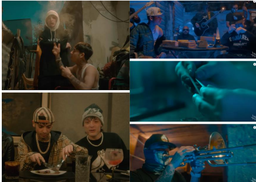
Figure 4 – Captures d'écran du clip PRC de Peso Pluma & Natanael Cano, 2023

Ensuite, les femmes, qui sont majoritairement considérées comme des trophées par les narcotrafiquants, sont représentées « Las morritas bien locas se van, Disfrutamos, esté bien o mal » 30 . Dans le clip vidéo, elles apparaissent à table comme de simples objets de satisfaction pour les hommes (Massiel Miranda Yanes & Shanny Valdes Salas, 2018) et participent à exacerber la virilité excessive des trafiquants de drogue. (Cabañas, 2012) Un travelling horizontal sur cette rangée de femmes nous permet d'en constater le grand nombre. Le placement des deux chanteurs au centre de la table les positionne comme éléments centraux : les femmes sont alors représentées de sorte à mettre en avant les hommes. C'est aussi le cas avec le grupo 31 , sur les différents scènes les chanteurs sont positionnés au centre et au-devant, asseyant ainsi leur position de chef.