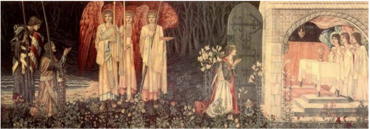
« Vision of the Holy Grail » (1890) par William Morris

Morris opposait ainsi les mérites de l'artisanat, de la belle œuvre, du travail bien fait, à la laideur industrielle et à l'abrutissement du travail en usine. En plus d'être l'inspirateur de la fantasy et de prendre part au courant de peinture pré-Raphaélite qui sera une influence durable pour l'illustration, il fut ainsi le promoteur du mouvement Arts and Crafts de renaissance des arts décoratifs et un pionnier de la préservation du patrimoine.