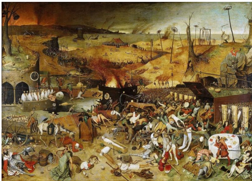
Figure 2: Le Triomphe de la Mort (1562) de Pieter Brueghel l'Ancien, musée du Prado, Madrid (Espagne).