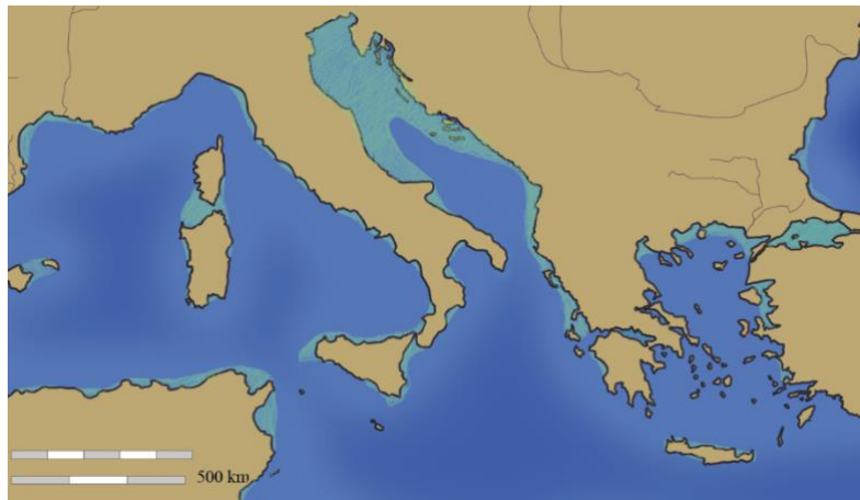
b - projection tirée du projet BD "Quand NOUS serons la Préhistoire"