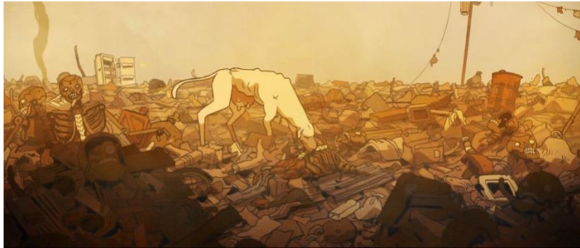
Figure 1 : Carbonne & Silicium (2020) Mathieu Bablet, Label 619

(Source : Carbonne & Silicium (2020) Mathieu Bablet, Label 619 reproduction autorisée par l'auteur)