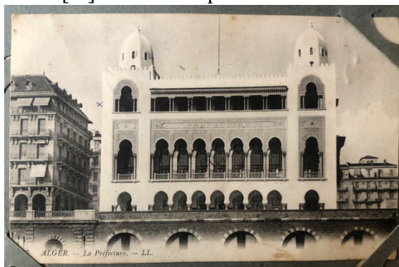
Fig. 3. Carte postale s.d. « Alger, La Préfecture ».

indique en haut la « galerie où [elle] promène bébé quand il fait mauvais temps », en bas « la salle des fêtes » et sur le côté « [sa] chambre » qui donne sur l'immeuble voisin.