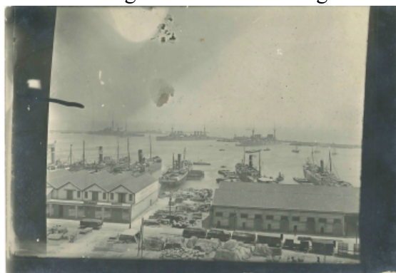
Fig. 4. Le port d'Alger, vue prise de la préfecture, s.d..

Elle envoie également une photo prise depuis les fenêtres de la préfecture pour rendre compte de sa vue : s'y étalent en contrebas le boulevard Carnot, la gare et le port d'Alger, soit un horizon urbain et monumental bien éloigné de la vallée bocagère de son village (fig. 4).