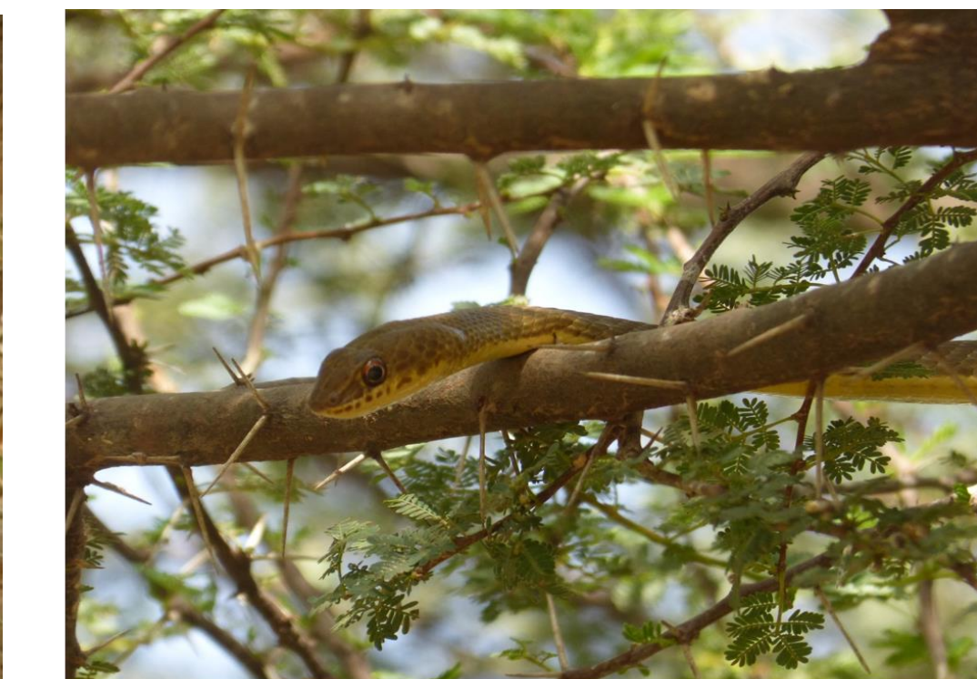
Psammophis afroccidentalis (Psammophidae)