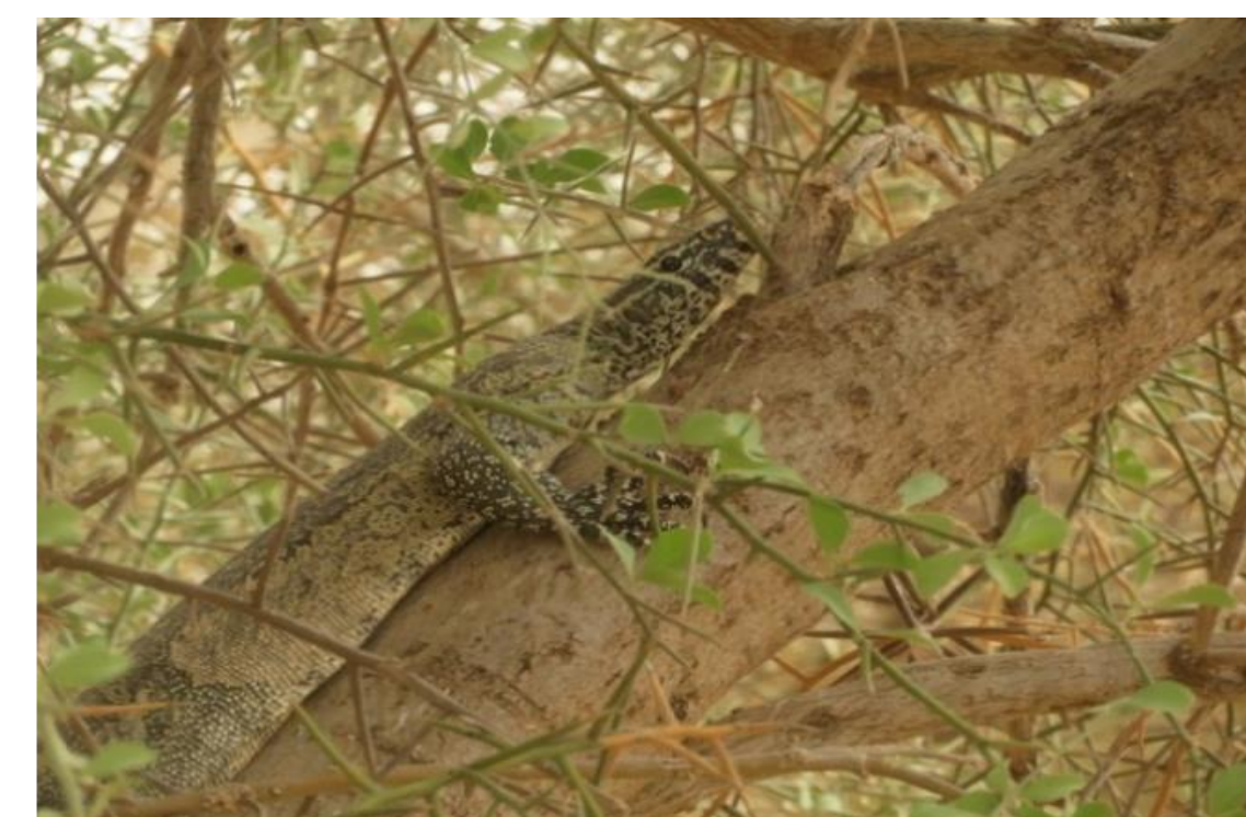
Varanus Niloticus (Varanidae)