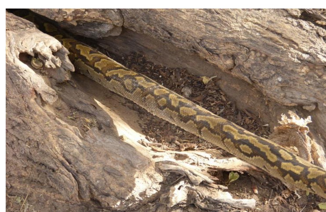
Python sebae (Boidae)