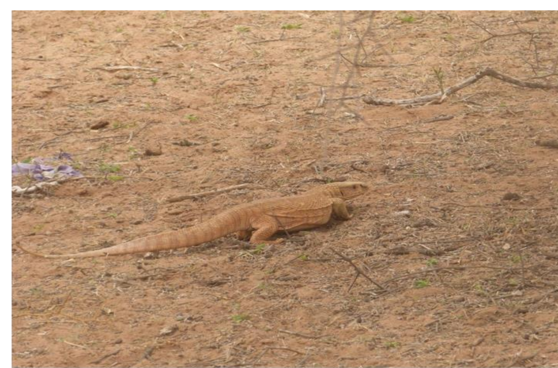
Varanus exanthematicus (Varanidae)