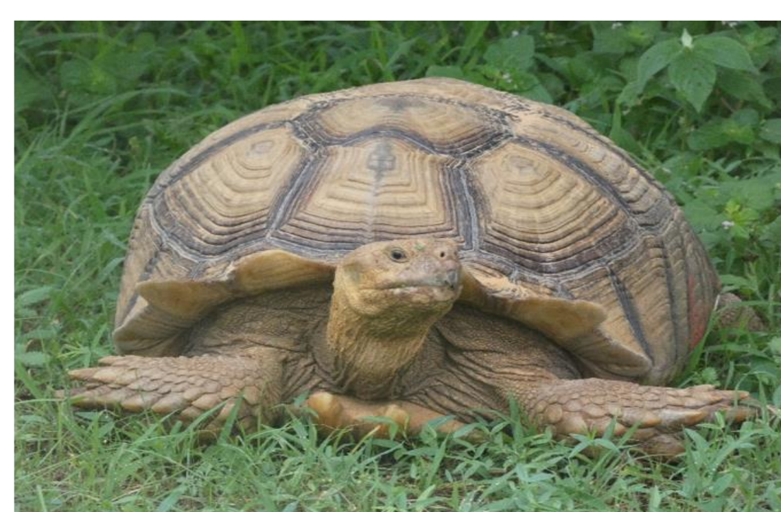
Centrechelys sulcata (Testudinidae)

12 espèces de reptiles ont été inventoriées dans la zone d'étude. Elles se répartissent en 6 espèces de lézards (Agamidae, Gekkonidae, Phyllodactylidae, Scincidae et Varanidae), 5 espèces de serpents (Boidae, Colubridae, Psammophida et Viperidae) et une espèce de tortue (Testudinidae) réintroduite dans la RNCKA. La plupart des espèces sont classées en préoccupation mineure dans la liste rouge de l'UICN à l'exception de deux espèces qui sont menacées.