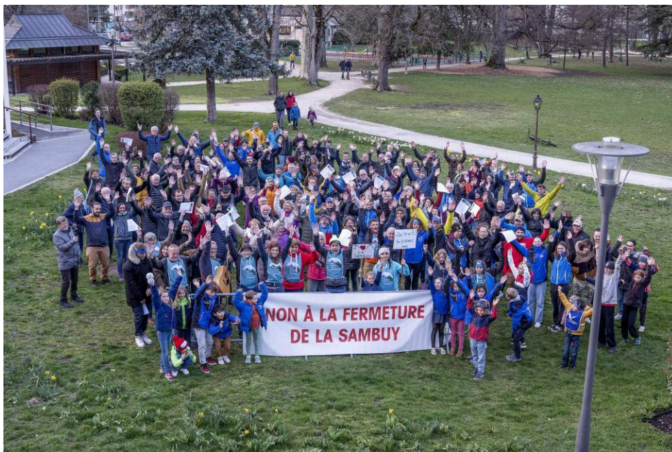
Illustration 3 : Photo d'une mobilisation en faveur du maintien du domaine skiable de la Sambuy.