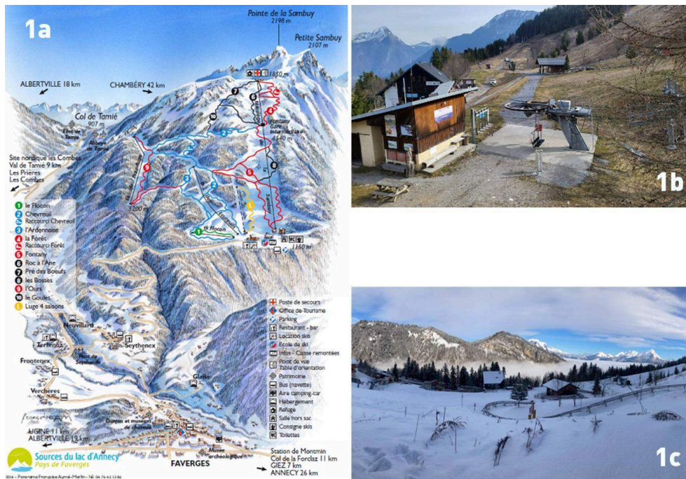
Illustration 1 : Plan et état des lieux de l'équipement du site de la Sambuy : un stade de neige représentatif de la forme de développement.