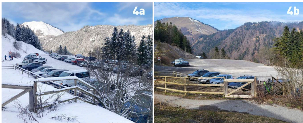
Illustration 4 : Un site alpin intermittent sans l'offre de loisirs ; la météo comme facteur décisif.

4a. Le parking quasi-plein (environ 80 véhicules) un jour de semaine hors vacances scolaires, le surlendemain d'une importante chute de neige. Un « Hot-Spot » du ski de randonnée du bassin annécien et albertvillois, vivant même sans appareils de remontées mécaniques. 11/01/2024