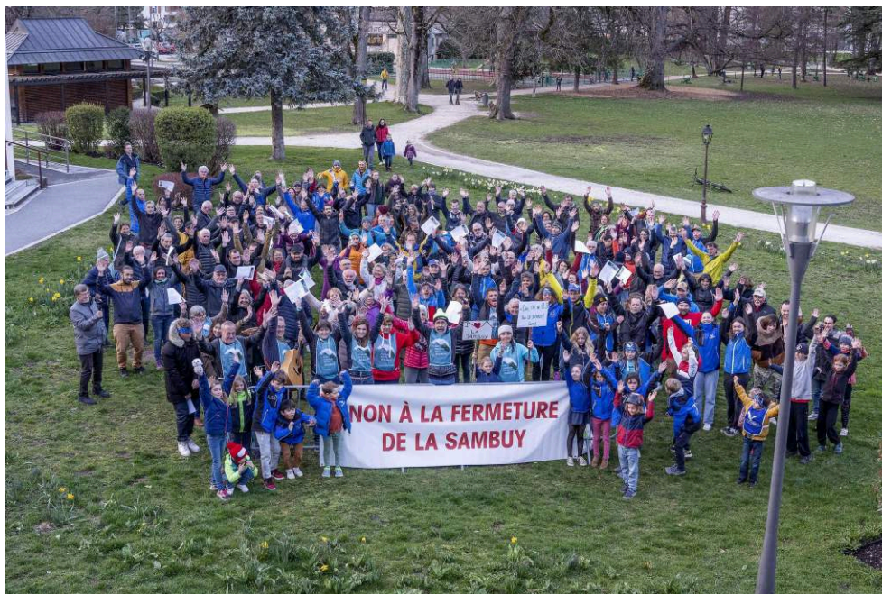
Illustration 3 : Photo d'une mobilisation en faveur du maintien du domaine skiable de la Sambuy.