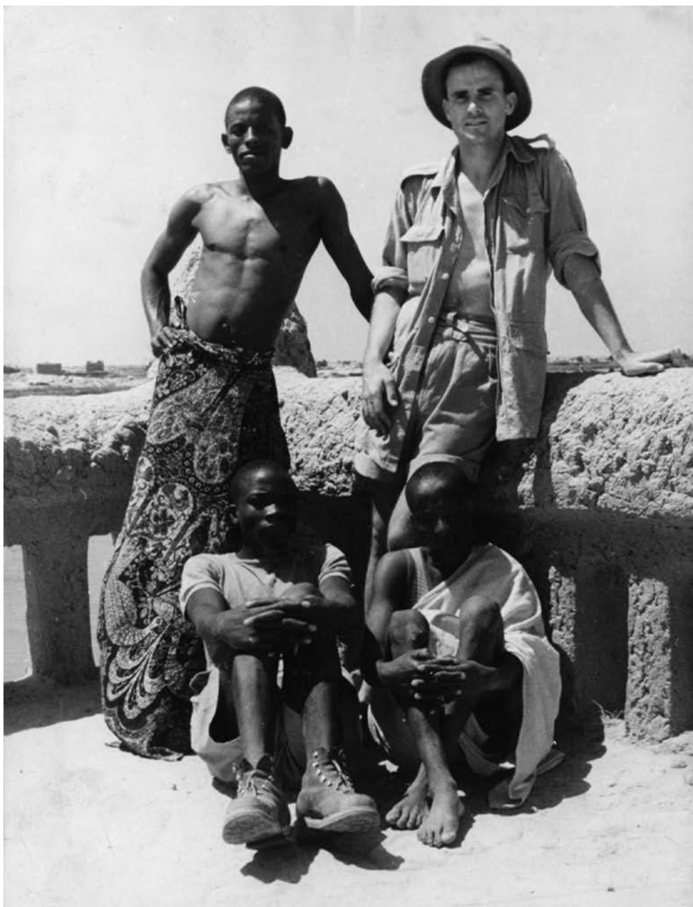
Jean Rouch