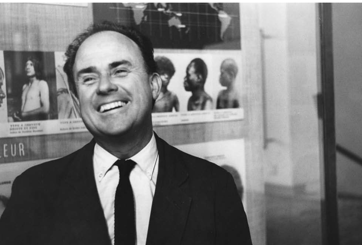
Jean Rouch

tique scientifique. Bien qu'elle ait encouragé l'élaboration d'une théorie du film ethnographique, cette circulation en vase clos n'a certainement pas facilité l'acquisition de la légitimité institutionnelle indispensable à la pérennité de cette démarche fragile et novatrice. Pourtant, celle-ci apparaît comme une pratique communément admise : pour réaliser un film documentaire (sociologique ou ethnographique), il semble désormais essentiel de maîtriser à la fois les connaissances du terrain et les procédés cinématographiques. C'est en cela que le CFE a largement contribué à entériner le modèle rouchien du cinéma ethnographique et à faire prévaloir la figure de l'ethnographe cinéaste sur le binôme chercheur et cinéaste. Dans la lignée d'André Leroi-Gourhan et de Marcel Griaule, Jean Rouch a été le grand artisan de cette vaste entreprise de professionnalisation et d'institutionnalisation d'un genre singulier. Son activité intense mais surtout son appartenance à de multiples réseaux scientifiques et cinématographiques ont été les moteurs incontestables d'un tel projet. Il est bien sûr important