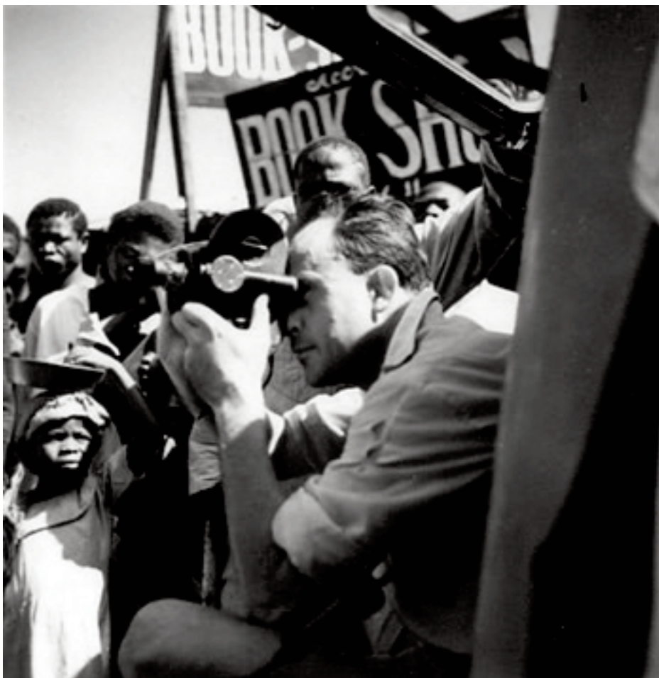
Jean Rouch

envoyée aux manifestations internationales comme déléguée du CFE, elle a rédigé plusieurs rapports retraçant les activités et les perspectives du CFE. Enfin, les comptes rendus d'activités de Jean Rouch au CNRS ont permis de développer les aspects relatifs à la reconnaissance du cinéma ethnographique par l'institution et ses rapports parfois ambivalents avec le CFE. Cette précieuse documentation devrait permettre d'éclairer un aspect peu connu de l'histoire du cinéma.