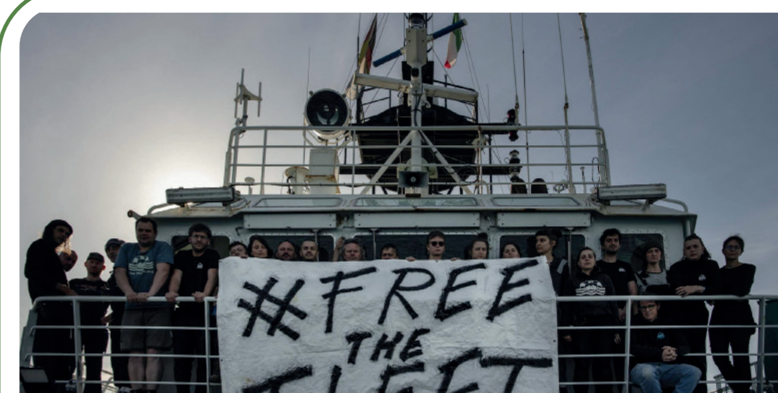
Ci-dessus : Photo de la campagne « Free de Fleet » portée par l'ONG Allemande Sea Watch e.V.

Outre le temps passé en mer de ces organisations, celles-ci pour des besoins techniques et matériels investissent certains ports européens, dont ceux avoisinant Syracuse. Il s'agira d'observer ces périodes de débarquement et les moments de vie à terre de ces organisations ainsi que leurs interactions avec les habitants de ces ports.