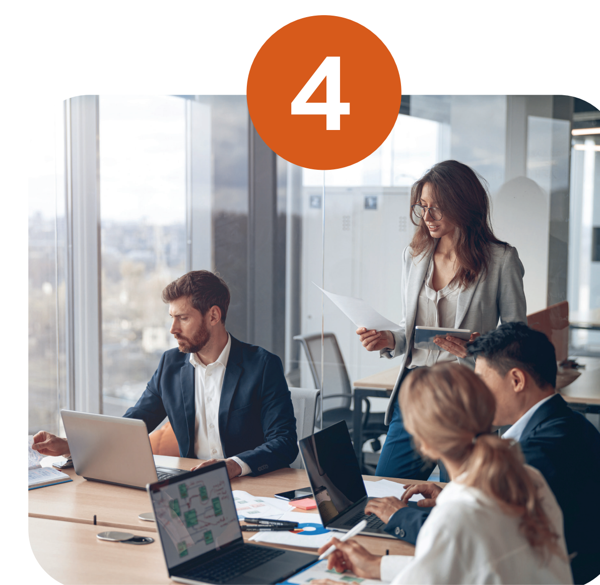
4 Coconstruction du plan d'actions avec l'adhérent