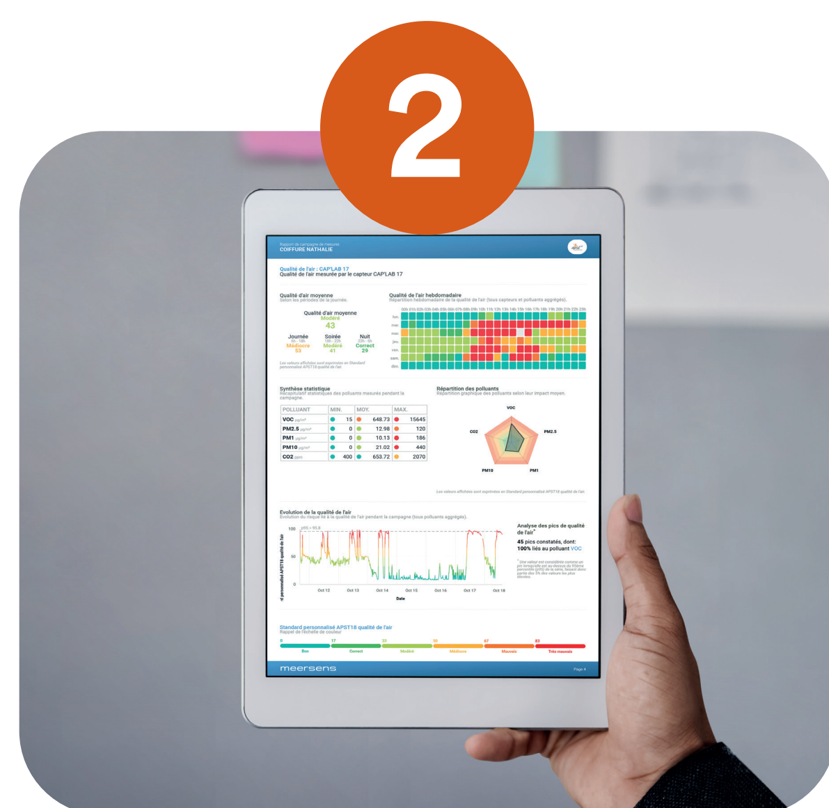
2 Analyse des rapports automatisés par l'équipe pluridisciplinaire