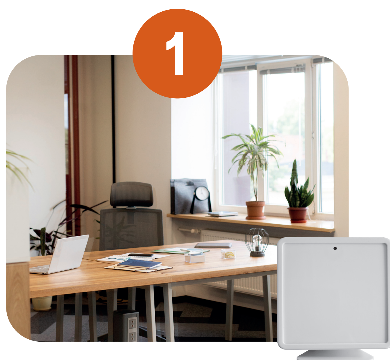
1 Pose des capteurs lors d'un rendez-vous dans l'entreprise

Des capteurs sont installés aux postes de travail dans les entreprises pendant au minimum une semaine. Ils permettent d'apprécier la qualité de l'air grâce au mesurage en continu des paramètres suivants : composés organiques volatils (COV), particules fines (PM1, PM2,5 et PM10) et dioxyde de carbone. Le bruit et la luminosité sont également mesurés ainsi que la température, l'humidité et la pression.