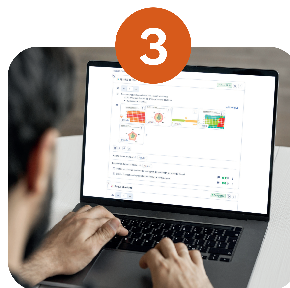
3 Restitution via le rapport et la fiche d'entreprise