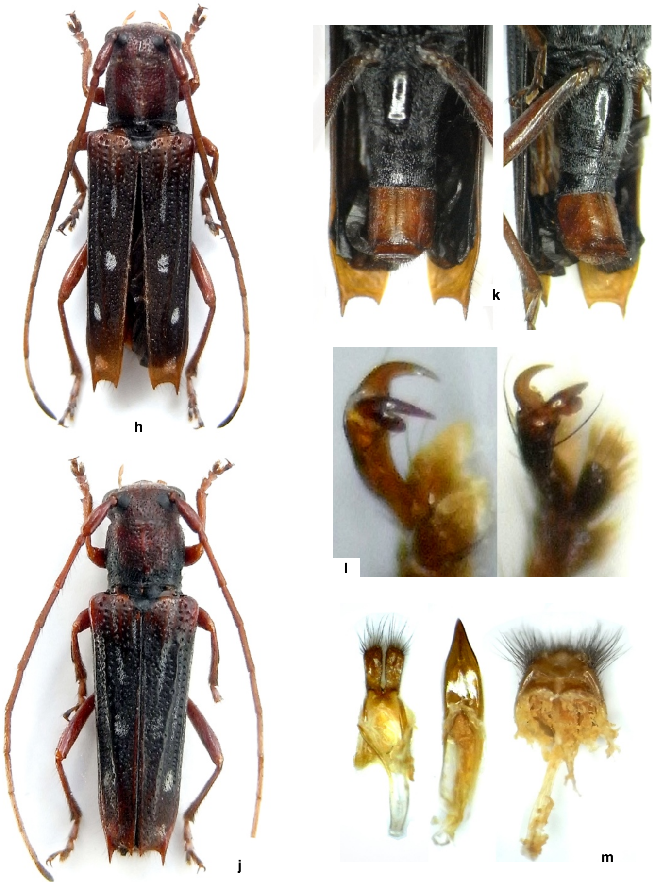
Fig. 2 h-m. Glenea (Lobunguiglenea) latericia n. sp., Laos (Houaphan).

h. ♀, paratype-1. j-k. ♀, paratype-2. l. ♂, holotype (gauche). ♂, paratype (droite). i. Onychium antérieur gauche. m. ♂, paratype, genitalia.