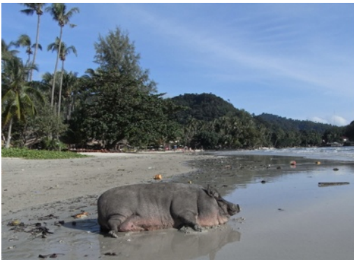
Illustration de la couverture :

Bain de mer. Ko Chang, Thaïlande, juillet 2013.