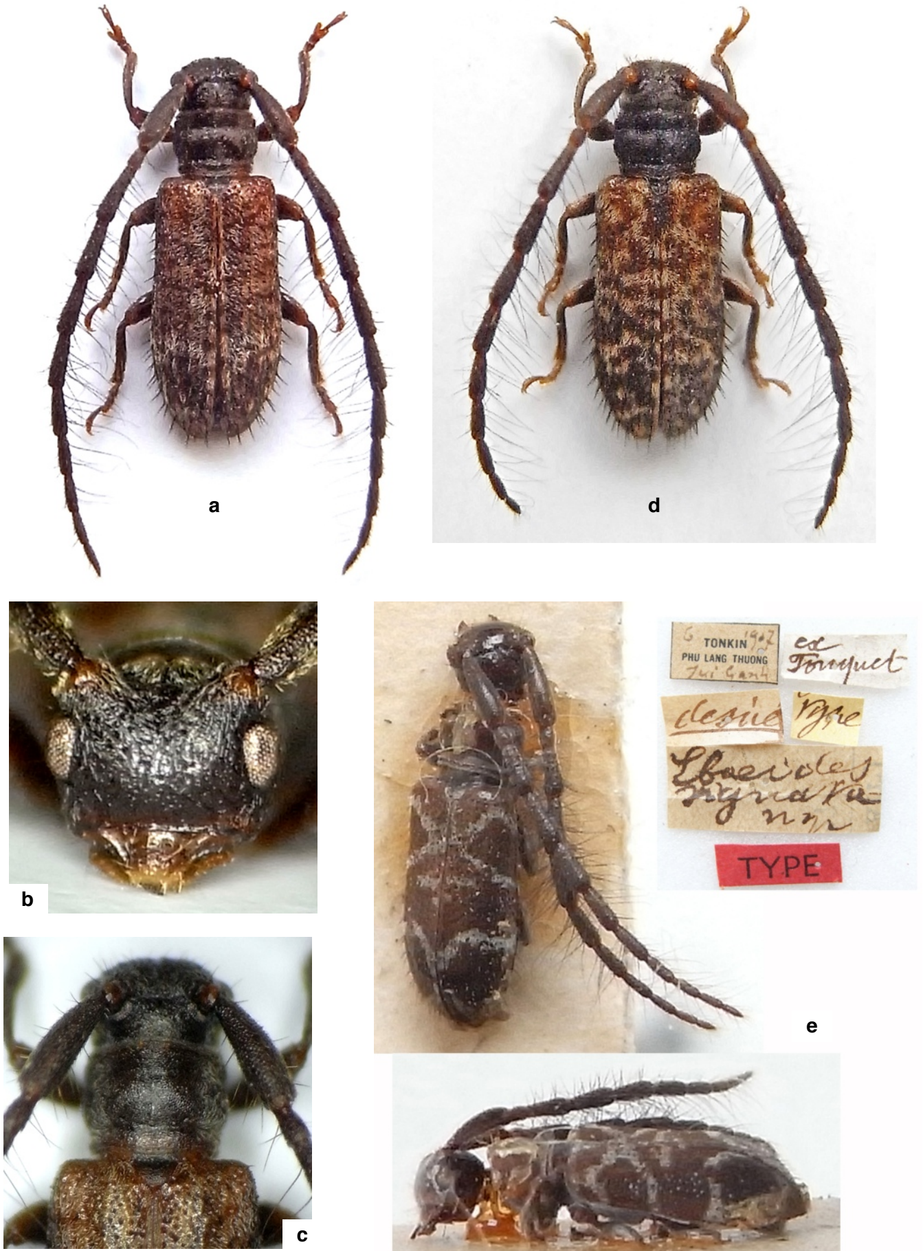
Fig. 1a-d. Ebaeides marmorata n. sp., Laos (Houaphan).