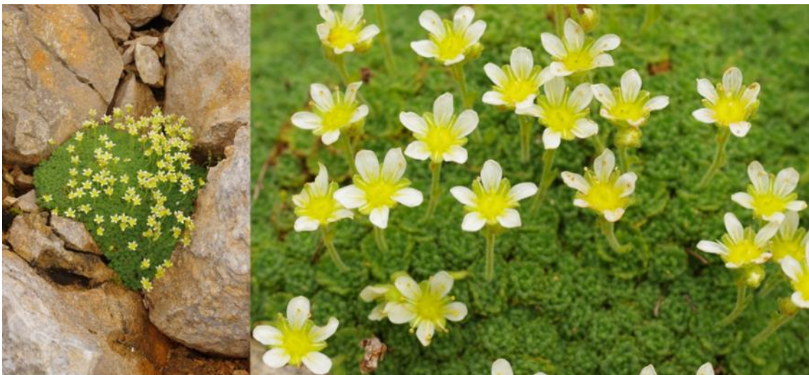
Figure 4 : Le saxifrage du Dauphiné, Saxifraga delphinensis , Grand Veymont, Vercors, © Alex Baumel.

évolutive qui cadre assez bien avec sa distribution au niveau d'une zone des Préalpes épargnée partiellement par les glaciations. Sur le plan taxonomique, décrit comme S. delphinensis par son découvreur, le curé de Villard-de-Lans (Ravaud, 1885), le saxifrage du Dauphiné est ensuite passé en sous espèce de S. exarata (Kerguélen, 1993), pour finalement revenir au rang d'espèce (Garraud 2004 ; Tison et Foucault 2014) et cela sans étude ad hoc . Cependant, si Baumel et al. (2023) ont confirmé l'existence de son originalité génétique, ils ont aussi révélé une introgression entre S. delphinensis et le saxifrage sillonné, S. exarata , et entre S. delphinensis et le saxifrage musqué S. moschata . Tandis que le génome des plastes, à hérédité maternelle, établit un lien de parenté entre le saxifrage du Dauphiné et S. vareydana , taxon endémique de Catalogne, les marqueurs nucléaires (à hérédité biparentale et sujets à la recombinaison génétique), soutiennent une contribution forte de S. exarata au génome de S. delphinensis . L'origine et la diversité génétique du saxifrage du Dauphiné sont donc déterminées par la rencontre, et la recombinaison, d'une lignée ancestrale, probablement d'origine ibérique avec la lignée de S. exarata dans les Alpes. La fréquence de leur introgression et leur différenciation morphologique, qui reste prononcée en sympatrie même, permettent de penser que ces saxifrages évoluent dans un syngaméon.