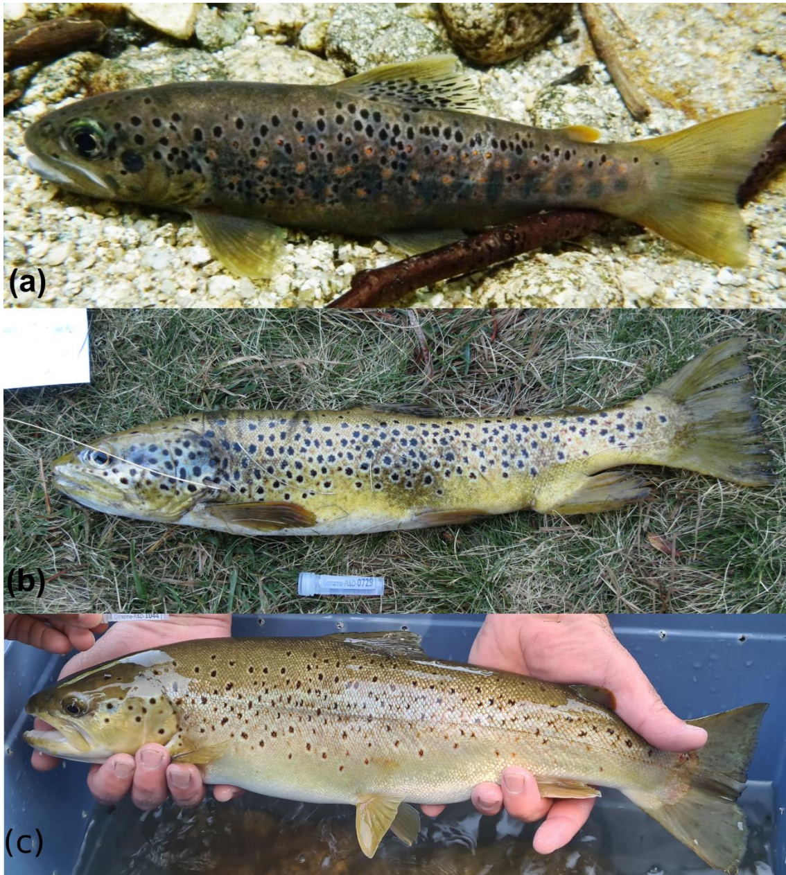
Figure 3 : Illustration du polymorphisme de la truite commune. (a) truite sauvage de Corse, © Stéphane Muracciole ONF. (b) truite domestique des Pyrénées orientales, © Adeline Héroult Fédération de pêche 66. (c) truite sauvage d'Ardèche, © Florent Nicodème, Fédération de pêche 07.

Cette situation s'explique par la grande diversité biologique, morphologique et écologique des populations de truites, dont la mise en valeur partielle pour la taxonomie correspond à l'application de critères de délimitation qui peuvent se contredire. Les différentes populations ou taxons correspondent à une gradation de l'ancienneté de leur divergence, de plus de 3-4 millions d'années (Ma) pour la divergence de S. trutta avec d'autres lignées telles que S. marmoratus , ou S. ohridanus et S. obtusirostris , à moins de 1 Ma, voir moins de 20 000 ans pour la