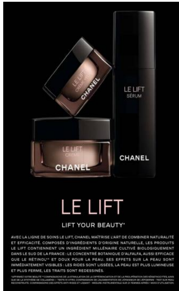
Figure 18 : Pub Chanel « Le LIFT – Lift Your Beauty » - ELLE Fr Février 2020

En outre, dans cette publicité, on constate que les publicitaires ont recours à l'hyperbole comme figure de style en utilisant l'expression « lift your beauty ». Ce choix discursif laisse entendre que l'utilisation du produit garantissant le lifting cutané assure également « l'augmentation » de la beauté de la consommatrice. Littéralement, l'expression signifie « élevez / haussez votre beauté » et, dans d'autres publicités de la marque, elle est traduite par « affirmez votre beauté ». Cependant, dans cette publicité extraite du corpus français, les publicitaires ont choisi de garder le slogan en anglais. Il s'agirait d'un choix délibéré qui représente un headline plus frappant et plus attrayant. En effet, l'emprunt à une langue étrangère est une forme de créativité lexicale assez présente dans le discours d'ordre publicitaire. Dans le discours publicitaire français, l'emprunt anglo-américain représente le terrain privilégié pour les créateurs publicitaires car la langue anglaise jouit d'un prestige inégalé. Lorsqu'on recourt à ce type d'emprunts, « un halo connotatif se construit autour de l'internationalité et de ses attributs positifs comme la puissance économique, la réussite, etc. » (Berthelot-Guiet 99). Le texte