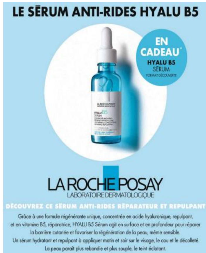
Figure 6 : Pub Sérums anti-rides La Roche Posay - ELLE Fr Octobre 2020