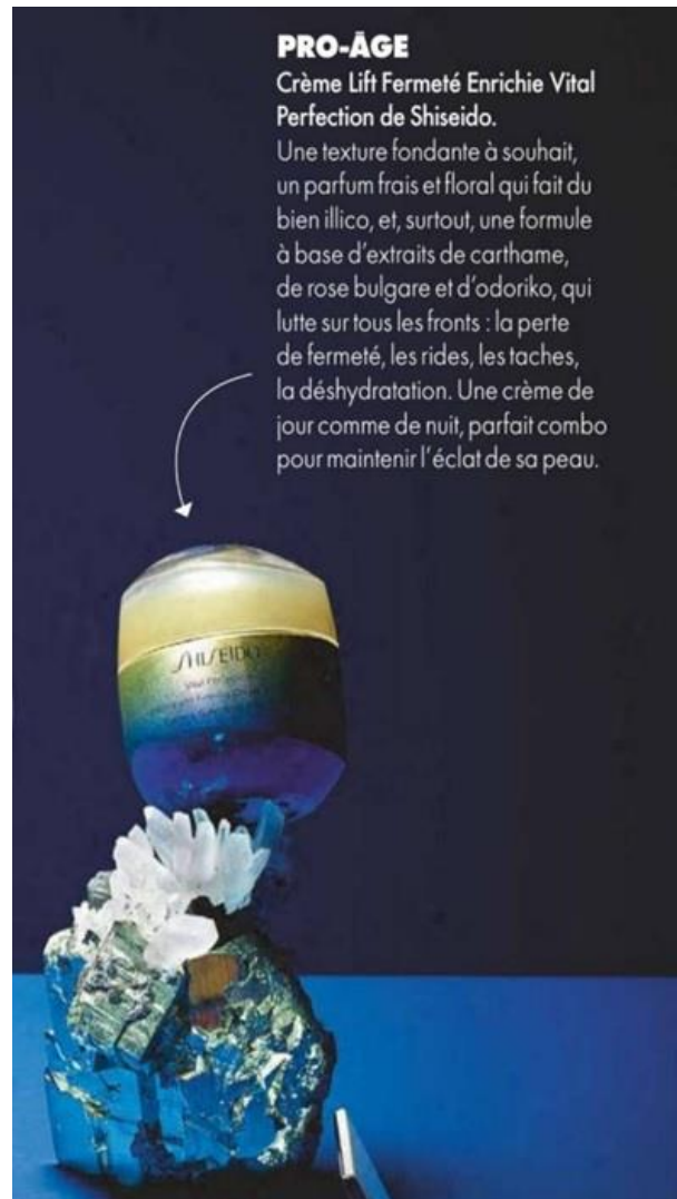
Figure 7 : Pub Crème Lift Fermeté « Pro-âge » - Shiseido

La marque Clarins a également introduit cette notion dans l'énoncé publicitaire par le biais d'une expression linguistique, et ce, en empruntant l'équivalent anglais du terme « pro-âge », à savoir « pro-ageing » qui apparaît 7 fois, accompagné d'une note de bas de page indiquant « en faveur des peaux matures » (voir Figure ci-dessous).