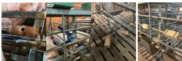
Photo 1 – Les quatre solutions testées en verraterie, de gauche à droite : le cylindre, l'objet en caoutchouc, la pieuvre et le tasseur

L'essai a eu lieu à la station expérimentale de l'IFIP (Romillé, 35). Trois bandes de 24 truies sont suivies au cours de toute la période de verraterie (4 semaines), soit 72 truies au total. Pour chaque bande les animaux sont répartis en blocs de quatre truies selon leur rang de portée. Chaque truie du bloc reçoit un objet différent. Les blocs sont répartis dans la salle afin de disposer certains objets entre deux truies de blocs différents.