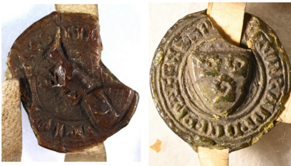
Fig. 3 – Gauche : queue en Y inversé (sceau de Pilgerin, n° 6 de 1330) – Droite : queue en Y (sceau de Cuntz de Pfaffenlapp, n° 12 de 1334). Les deux photos ont été réalisées avec des appareils différents d'où la différence de teinte.

Si la cire, d'après sa couleur, paraît être semblable entre les chartes, et peut-être émaner de la chancellerie municipale, deux petits détails diffèrent entre les deux séries de sceaux et nous amènent à nous interroger sur la responsabilité des opérations de scellement et le sens qu'on a pu vouloir leur donner. Le premier aspect concerne la double queue de parchemin: ses deux bandes n'ont pas été laissées droites et verticales dans la galette de cire, mais l'une d'elles a été pliée pour former un angle droit et ainsi ressortir par l'un des côtés de l'empreinte, perpendiculairement à l'autre bande de parchemin. Cette technique renforçait l'adhérence de la cire à son attache et empêchait l'empreinte de glisser ou d'être tirée. Sur les sceaux de 1330, la languette ressort systématiquement par le bord droit des empreintes (à la gauche de l'observateur donc), formant un "Y inversé". Sur ceux de 1334 – à l'exception des sceaux n°1 et 10 – c'est au contraire sur la gauche de l'empreinte que déborde la bande de parchemin qui forme un Y "normal" (Fig. 3).