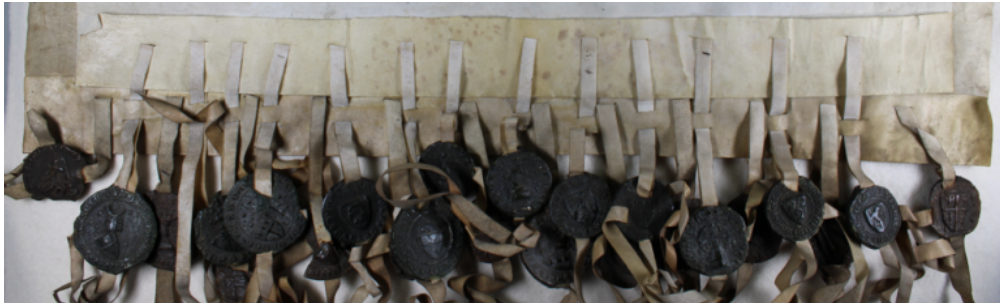
Fig. 1 – AVES, CH 41 / 895 : Les deux séries de sceaux sur double-queue de parchemin.

La seconde charte est un transfixe de la première: les attaches en double-queue de parchemin ont été insérées entre deux attaches dans le repli du premier acte, de sorte qu'il y a une alternance presque parfaite entre les sceaux du collège des échevins de 1330 et ceux de leurs successeurs de 1334 (Fig. 1 & 2). Les premiers encadrent les seconds, autrement dit, le sceau le plus à gauche et le sceau le plus à droite de la série de 25 empreintes appartiennent à la charte de 1330. Pour permettre l'insertion des 13 sceaux de 1334, deux paires d'empreintes se retrouvent dans un même intervalle (respectivement les sceaux en position n°2 et 3 de 1334 entre les n°2 et 3 de 1330 et les n°6 et 7 de 1334 entre les n° 5 et 6 de 1330) (Fig. 2).