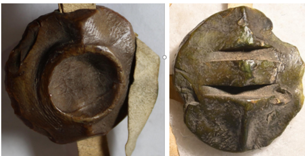
Fig. 4 - Dos des deux empreintes (1330 à gauche, 1334 à droite) du sceau de Nicolas de Grostein, monnayeur de la ville.

Une logique de différenciation similaire semble avoir eu cours pour le revers des empreintes: en 1330, une trace circulaire occupe le centre du disque (Fig. 4). Les marques de doigt ou de phalange se sont imposées sur les empreintes de la région depuis le milieu du XIII e siècle 3 . Toutefois, étant donné la netteté du rebord et sa parfaite circularité, nous pourrions être en présence, en l'espèce, de la trace laissée par le bout du manche d'un outil tel peut-être celui du couteau dont se servaient les scribes pour tailler leur plume. En 1334, ce sont en revanche deux rainures horizontales et parallèles qui ont été systématiquement pratiquées (Fig. 4). Elles pourraient avoir été faites à l'aide de l'appendice de préhension du sceau comme le suggère Damien Berné à propos de sceaux contemporains des évêques de Strasbourg 4 .