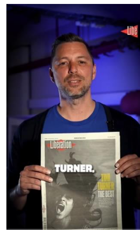
Figure 1 - Captures d'écran de la vidéo TikTok de Libération qui montre une journée de travail à la rédaction.

L'analyse du contenu démontre que de manière commune pour les trois médias, le journalisme s'appuie sur un travail de co-écriture, en concertation et en dialogue avec les jeunes du RSN. Les médias, comme nous le voyons ici pour Libération (Fig.1) négocient leur légitimité auprès des internautes en s'appropriant les codes de TikTok. « Qu'est-ce que le journalisme ? Comment travaillent les journalistes ? » Ces questions font l'objet de vidéos dans lesquelles les journalistes, en dévoilant les coulisses du métier répondent aux interrogations formulées par les internautes. Ces formats mettent en évidence les espaces et les outils de travail associés au journalisme et créées ainsi une proximité entre le journaliste et son public.