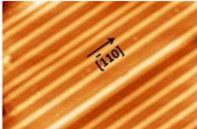
Figure 3 – Image STM topographique après dépôt de 0.3 MC de Si/Au(110) (Image prise de la référence [1])

[4] R. Bernard et al, Growth of Si ultrathin films on silver surfaces: Evidence of an Ag(110) reconstruction induced by Si , Phys. Rev. B Vol 88 no12, 2013, 121411(R)