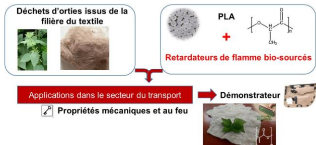
Figure 2 – Le projet BIOREV

La fabrication du renfort non-tissé constitué de fibres d'ortie et de fibres de PLA commerciales a été optimisée par le CETELOR, partenaire du projet. Comparé au chanvre, l'ortie permet une amélioration du module d'élasticité. Un screening des RFs biosourcés commerciaux (tanins, lignine, alginate...) ou modifiés, sélectionnés après une étude bibliographique, est réalisé en caractérisant la dégradation thermique (ATG) et le comportement au feu (PCFC, indice limite d'oxygène, cône calorimètre, UL94) des formulations PLA/RFs obtenues par voie additive (mini-extrusion). Les premiers résultats montrent que la combinaison non-tissé imprégné RF/PLA ignifugé est une voie très prometteuse.