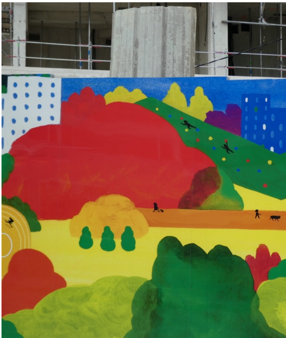
Charline Collette, Sans titre, 2022, palissade rue Saint-Denis à Saint-Ouen sur la ZAC Village des athlètes (septembre 2022)

Dessinée en atelier, imprimée puis collée sur la palissade, la fresque représente donc un ensemble de petits personnages vaquant à leurs activités quotidiennes, et notamment sportives. Comme on peut le lire sur le site de l'aménageur de la ZAC :