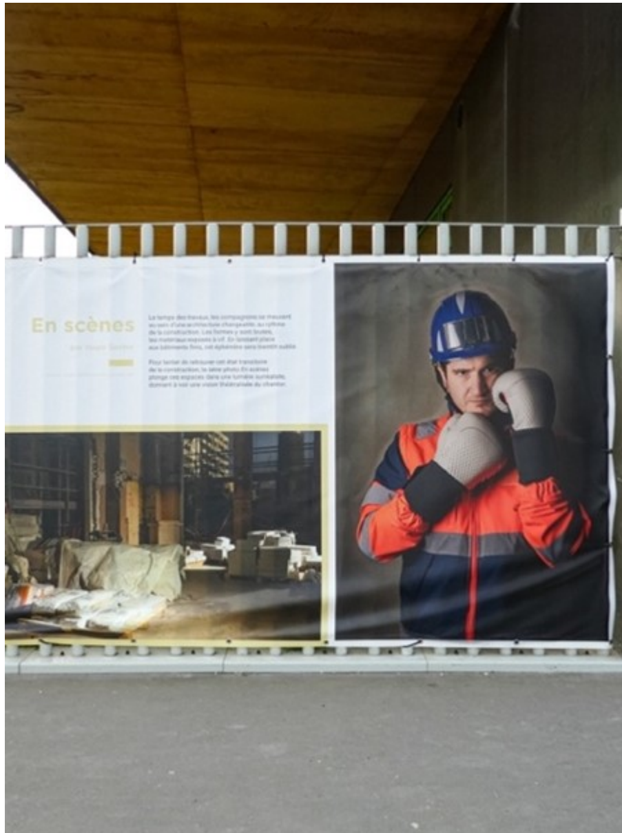
Leïla Graindorge, Bertrand (photographie modifiée), 2023, palissades devant le collège Dora Maar, rue Ampère, ZAC Village des athlètes à Saint-Denis (mars 2023).