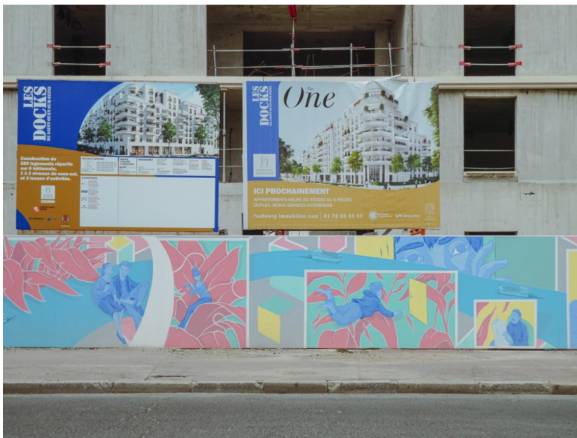
Limo Onoff, Sonate au bord de l'eau , 2022, palissade de l'éco-quartier de la ZAC des Docks à Saint-Ouen (septembre 2022)

L'usage de ces codes du récit s'inscrit au sein d'un tournant narratif, ou âge narratif, marqué par une émergence du storytelling 31 et de la capacité à se raconter, et ici à raconter les mutations urbaines du Grand Paris. Dans ce contexte, où il s'agit de plus en plus de « mobiliser les émotions par la pratique des récits partagés 32 », les artistes sont incité-es à user largement de ces codes pour représenter des pratiques partagées de l'espace public. La fresque de Charline Collette à Saint-Ouen, commandée par l'aménageur de la ZAC Village des athlètes (fig. 5), rend elle aussi compte de ce mode narratif.