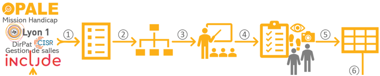
Figure 1. Processus de modélisation des caractéristiques des salles.