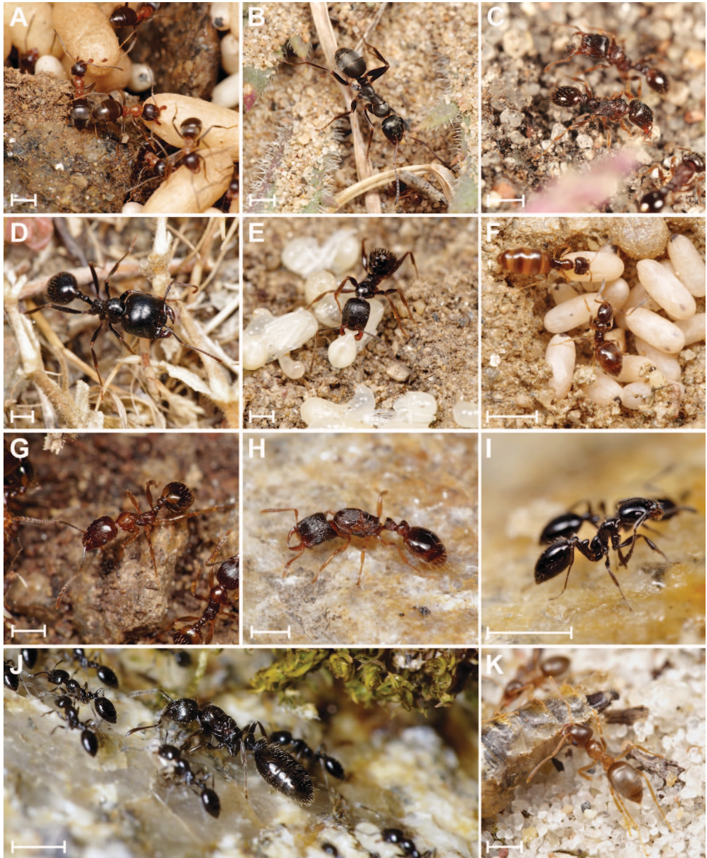
Fig. 2. - Fourmis de l'île d'Yeu. - A, Lasius emarginatus (Olivier) et couvain sexué. - B, Formica cunicularia Latreille. - C, Tetramorium gr. caespitum (Linnaeus). - D, Messor capitatus (Latreille). - E, Aphaenogaster gibbosa (Latreille) et couvain. - F, Plagiolepis pallescens Forel et couvain. - G, Aphaenogaster subterranea (Latreille). - H, Strongylognathus testaceus (Schenck), reine après vol nuptial. - I, Monomorium carbonarium (Smith). - J, Monomorium carbonarium (Smith), reine et ouvrières en cours de déménagement. - K, Lasius psammophilus Seifert. Échelles : environ 1 mm.

LENOIR, 1971) et dont l'aire de répartition semble s'étendre au nord et le long de la côte atlantique française au sein de milieux thermophiles (BAUGNÉE & GODEAU, 2000). Enfin, P. pallescens est une minuscule espèce de fourmi spécialiste de milieux rocheux (SALATA et al. , 2018), créant des colonies de quelques centaines d'ouvrières notamment