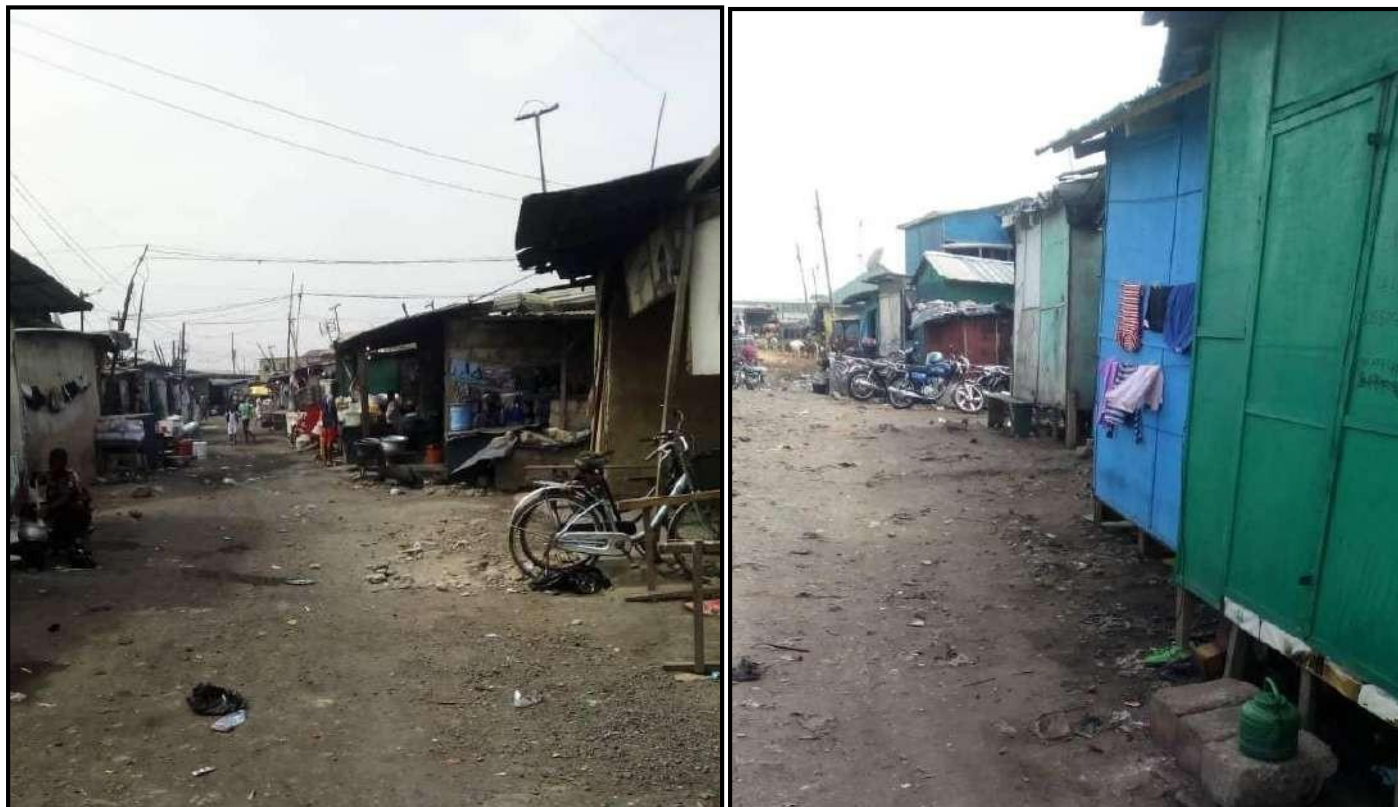
Planche photographique 2 : Dortoirs des Kayayéi à Agblogboshie (Accra)