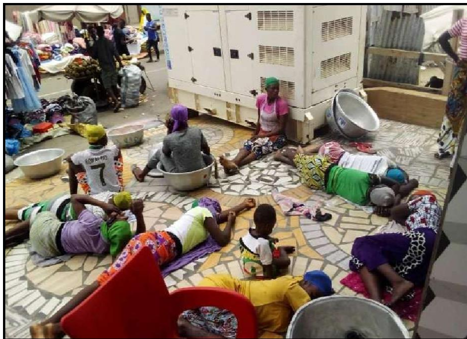
Photo 3 : Des kayayei se reposent devant le magasin d'un grossiste de fripes

Crédit : Léopold KOUAKOU, Accra-Kantamanto, 2020.