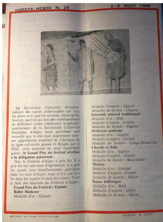
Horoya Hebdo , n° 28, 26 juillet-1 er août 1969, quatrième de couverture.