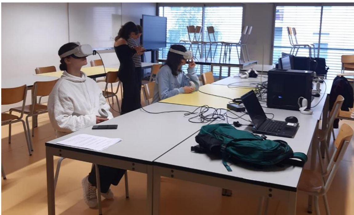
Figure 2 : Notre intervention lors d'une séance de TD acoustique à l'ENSA Nantes.