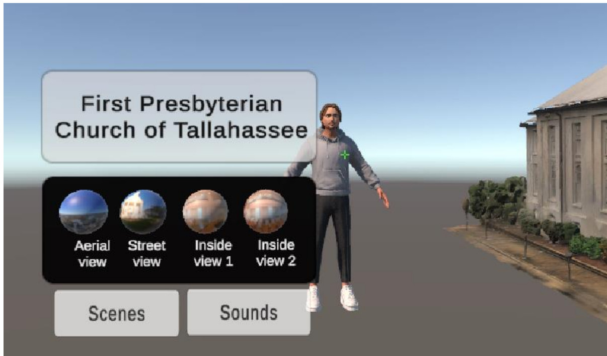
Figure 1 : Utilisation de l'IA pour créer un avatar interactif afin de guider et assister les étudiants dans l'environnement virtuel de First Presbyterian Church of Tallahassee.

Dans le cadre de cette thèse, nous adoptons une approche centrée sur les ambiances numériques dans le processus pédagogique. Pour cela, nous examinons l'utilisation de la réalité virtuelle et de l'intelligence artificielle générative et interactive à travers des expérimentations menées sur des sites distincts. Nous intervenons ainsi dans des cours différents, adaptés à des niveaux de compétence et des connaissances variés des élèves. Bien que les objectifs des étudiants varient selon le cours, la recherche demeure concentrée sur les trois questions mentionnées précédemment. En fonction des objectifs spécifiques à chaque cas d'étude, nous adaptons la méthode ADDIE (Analyse, Conception, Développement, Implémentation et Évaluation) (Cahagne and Fuzet 2022) pour concevoir une expérience immersive. Cette démarche est complétée par une approche méthodologique mixte qui intègre à la fois des techniques quantitatives et qualitatives, afin de répondre aux questions de recherche (Pinard, Potvin, and Rousseau 2004). Ainsi, la méthodologie globale reste la même, mais elle peut être modifiée en fonction des objectifs définis et des contraintes spécifiques à chaque expérimentation. Cette étude explore donc différentes approches pour traiter les questions de recherche et propose des solutions adaptées à chaque cas d'étude.