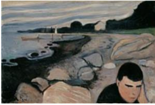
Fig.4 Edvard Munch, Mélancolie 1892 II , 2019 Huile sur toile, 64 x 96 cm