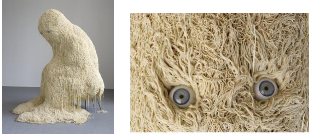
Fig. 3 Théo Mercier, Le solitaire , Laine synthétique, résine, polystyrène, Musée d'art moderne de la ville de Paris, 2010 (2, 30 m de haut)

Il s'agit d'un personnage entièrement recouvert d'une épaisse couche que l'on perçoit de prime abord comme étant des spaghettis : il s'agit en réalité de laine synthétique fixée par de la résine sur une structure en polystyrène. Ainsi prostré et entièrement recouvert, le corps du Solitaire n'est plus qu'un amas de matière dégoulinante et gluante. A la limite de l'informe, le personnage le dos courbé et la tête baissée tel un penseur, incarne la pesanteur d'une existence ensevelie sous le poids de ce matériau trivial. Les pseudo-spaghettis périssables se réfèrent à un produit alimentaire populaire et périssable et à un mode de consommation excessif. Cette sculpture anthropomorphe masquée par un trop-plein de matière laisse entrevoir deux petits yeux ronds, des yeux d'emprunt rappelant ceux des peluches et des poupées. Perdu dans la masse, le regard semble empreint de détresse et contraste avec l'aspect ridicule de la posture. Il invite tout autant à la pitié qu'au rire lorsqu'on s'aperçoit que ce corps massif est devenu trop lourd pour le petit siège d'enfant sur lequel il est assis. Son corps et ses pensées englués sous le poids du matériau le figent et le privent de tout lien avec le dehors. Sous l'épaisse couche qui le recouvre et déborde de toutes parts, le personnage perd sa particularité charnelle et devient « un Je sans nom et sans visage. »