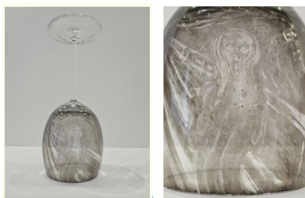
Fig. 8 Patrick Neu, cristal et noir de fumée

https://www.artscape.fr/munch-musee-orsay/