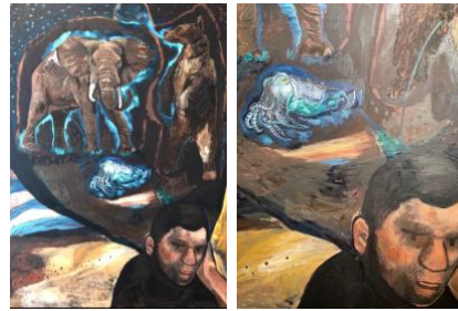
Fig. 5 Damien Deroubaix, Mélancholia II , 2019 Huile et collage sur toile, 250 x 180 cm

Dans les deux tableaux ci-dessus, réalisés à plus d'un siècle d'écart, la figure archétypale de la posture mélancolique demeure. Placé au premier plan dans le coin droit du tableau un personnage est de trois quarts, cadré de façon à ne montrer que le visage et un début d'épaule, les yeux baissés ou le regard perdu dans ses pensées, la tête appuyée sur sa main gauche. Il semble se retirer de l'univers qui l'entoure. Les éléments figuratifs, la composition, les couleurs sombres du tableau et les lignes sinueuses d'Edvard Munch sont des éléments plastiques qu'on retrouve sur l'œuvre de Damien Deroubaix (Fig. 5). Toutefois l'arrière-plan diffère radicalement de celui de la toile d'Edvard Munch qui illustre le désespoir amoureux de son ami Jappe Nilssen.