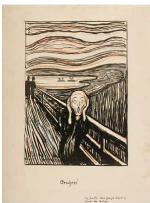
Fig. 7 Edvard Munch, Le Cri , Lithographie

C'est également en convoquant une œuvre d'Edvard Munch que Patrick Neu évoque la noirceur du monde. Il reprend dans son travail le célèbre motif d'une lithographie : Le Cri (Fig.7), qui illustre la phase dépressive extrême du mélancolique.