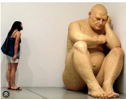
Fig. 2 Ron Mueck, installation, sans titre , Galerie nationale du musée de Berlin, Allemagne 2000 Résine de polyester pigmentée sur fibre de verre, 203,8 x 120,7 x 204,5 cm