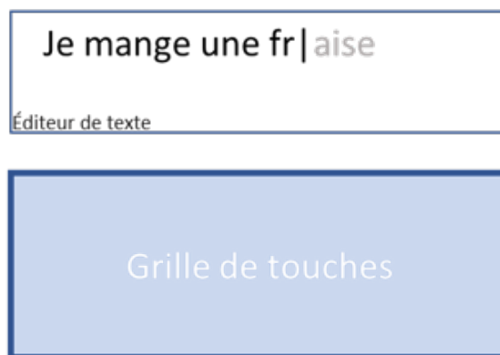
Figure 2. Exemple d'intégration de la prédiction de mots à l'éditeur de texte

Une solution alternative d'intégration, toujours pour optimiser le recours à la prédiction de mots, est d'intégrer la prédiction non pas dans le clavier mais dans la zone d'affichage de la saisie du texte (Figure 2). Cette solution consiste à afficher une proposition de complétion directement dans l'éditeur de texte, ceci à partir de la meilleure prédiction (mot de plus haute probabilité d'occurrence). L'objectif est d'inciter l'utilisateur à consulter au moins une proposition de prédiction lors de la saisie avec un intérêt principal : le regard reste alors focalisé sur la zone d'édition.