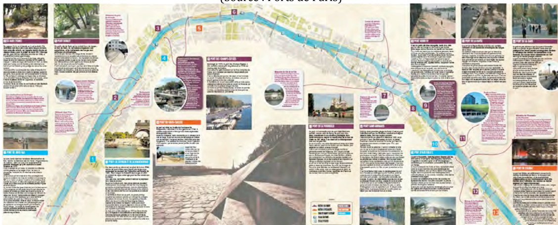
Figure 1. Le waterfront parisien