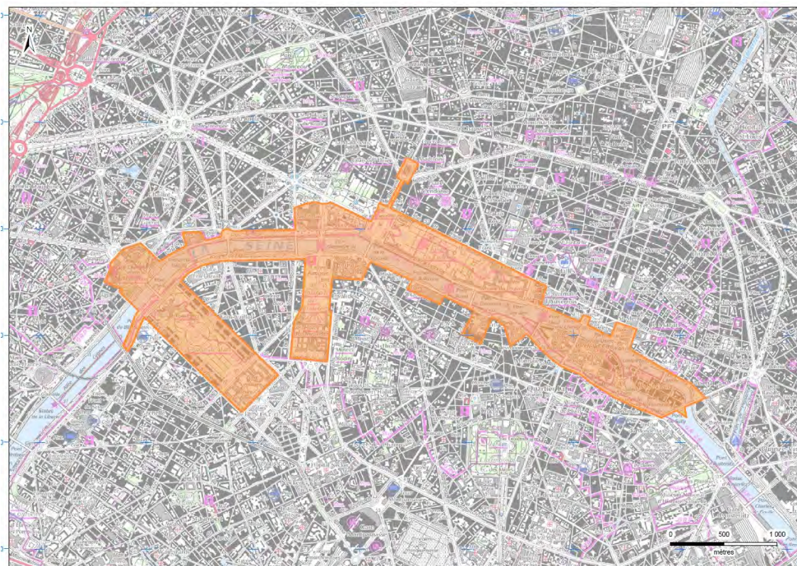
Figure 4. Le site des Rives de la Seine inscrit au Patrimoine mondial

National au pont du Garigliano, qui correspondait aux limites de la Ville de Paris) participe de la sélectivité socio-spatiale des recompositions contemporaines des waterfronfs. Comme l'explique la justification de l'inscription sur la liste de l'Unesco - qui se fonde sur la traditionnelle distinction entre Paris d'aval, « royal, puis aristocratique », et Paris d'amont, « portuaire et batelier » -, « c'est cette partie noble de la ville qui est retenue ici ».