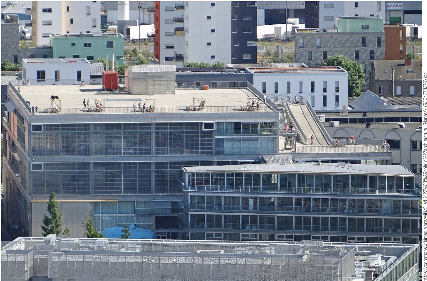
Vue de l'École nationale supérieure d'architecture de Nantes (ENSA Nantes), conçue par les architectes Anne Lacaton et Jean-Philippe Vassal. Le bâtiment a été livré en 2009. 30 juin 2013, Jean-Pierre Dalbéra, CC BY 2.0.

La base de données des bilans d'émission de gaz à effet et serre (BGES) de laboratoires constitue une ressource précieuse pour mener des études et est, à ce jour, unique au monde.