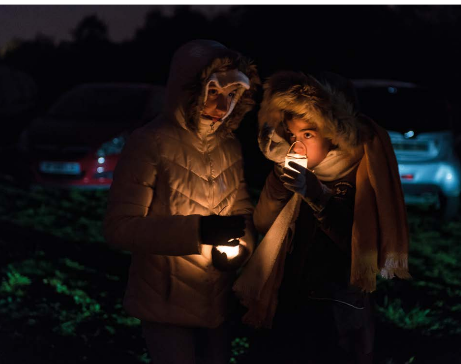
© Jean-Baptiste Guerresquin - studio Ad Lucem - L'Observatoire de la nuit

Les codes culturels, temporels et d'usages qui régissent un territoire et une société nocturnes représentent un réseau de connaissances à acquérir, par