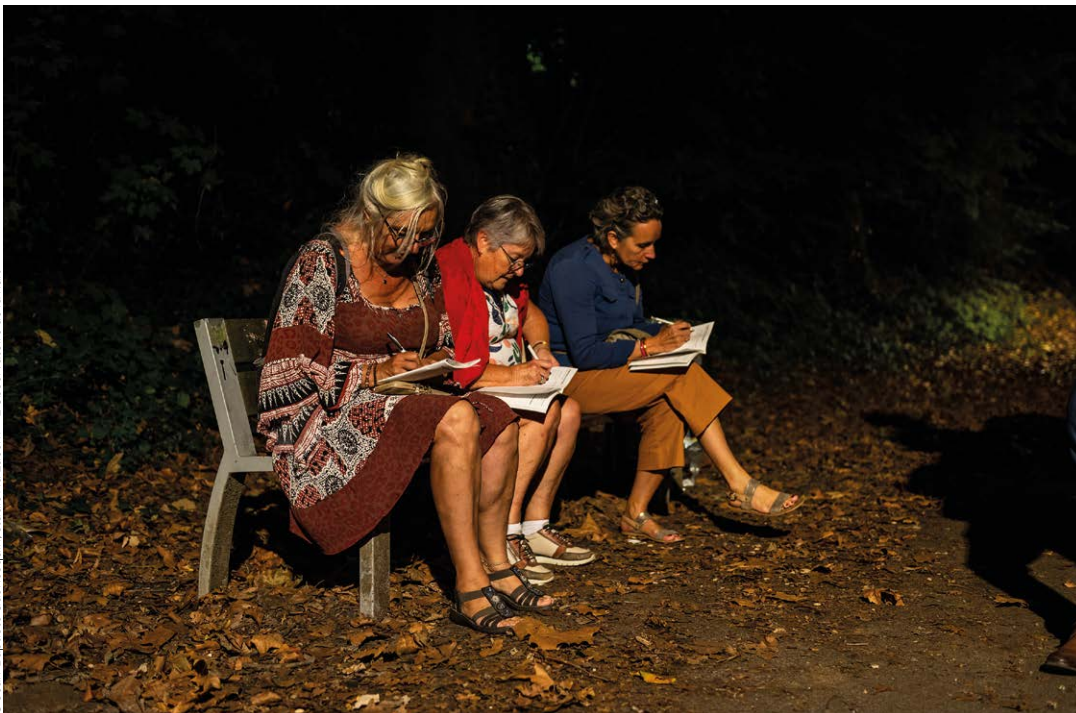
Atelier Obscurités à La Roche-sur-Yon (85), 2023. Les habitants sont invités à explorer l'espace public nocturne et à apporter leur témoignage sur le niveau de correspondance entre l'éclairage, les usages et les rythmes des lieux.

Témoignage d'une participante lors d'un atelier de sensibilisation dans le Parc naturel régional des volcans d'Auvergne, 2023. Ce témoignage s'intègre dans une démarche élargie de récolte des expériences et des avis individuels autour de la nuit menée par L'Observatoire de la nuit et intitulée Noctines .