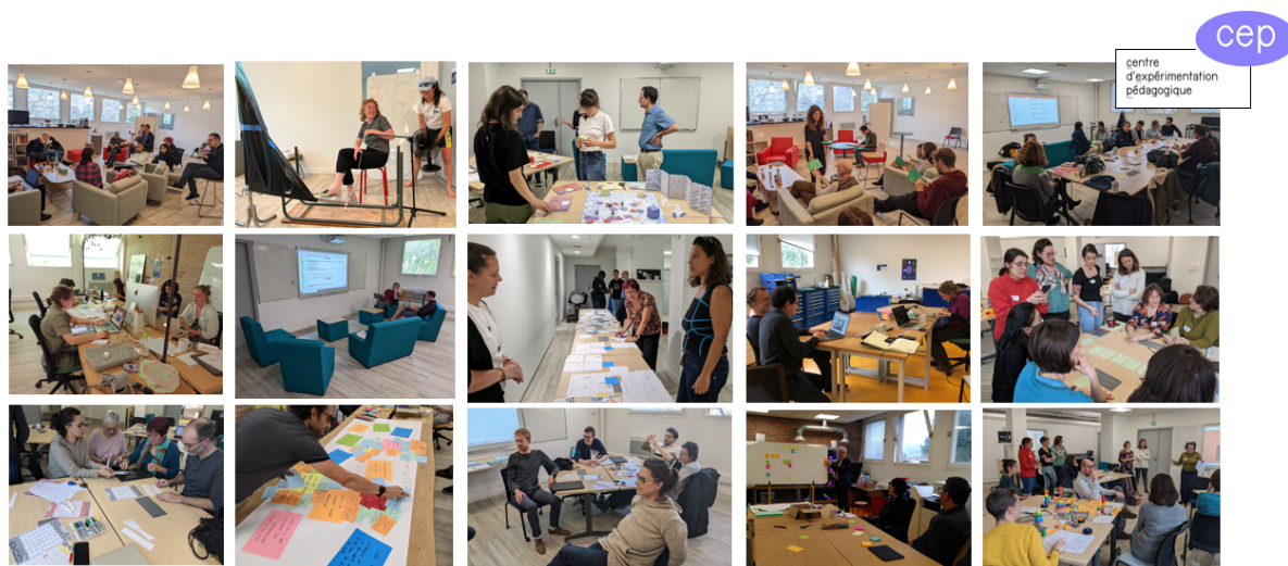
Figure 1. Le Centre d'expérimentation pédagogique de l'Institut Villebon-Georges Charpak.

Parmi les activités régulièrement proposées et qui permettent de soutenir la dynamique collective, nous pouvons citer des temps de formations (e.g. formation aux statistiques ; à la conduite d'entretien ; à la métacognition), des retraites de rédaction, des temps d'échange pédagogiques ou encore des rencontres « Journal Club » de partage bibliographique.