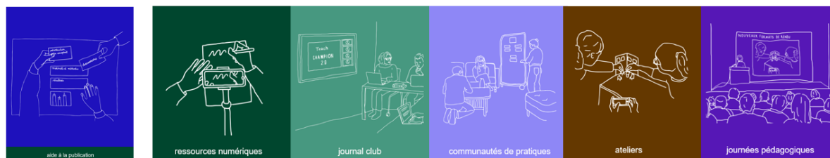
Figure 2. De multiples activités.

Cet accompagnement a permis d'aboutir à 31 communications acceptées en congrès et à 3 publications dans des revues à haut comité de lecture (2 sont encore en révision). D'autres retombées pourraient être mentionnées telles que la création d'outils d'accompagnement, l'ouverture de nouvelles unités d'enseignement et de formations continues, de retombées financières pour les praticiens.