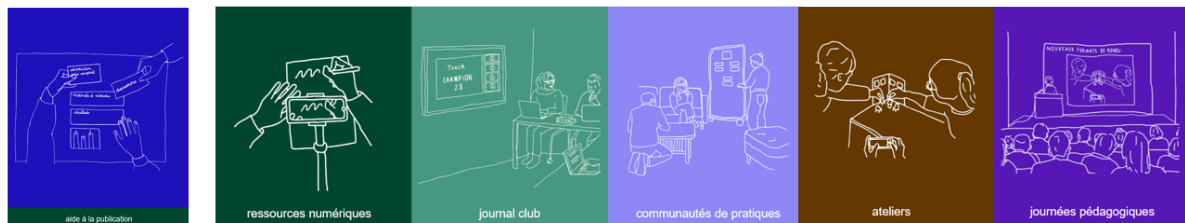
Figure 2. De multiples activités.

Cet accompagnement a permis d'aboutir à 31 communications acceptées en congrès et à 3 publications dans des revues à haut comité de lecture (2 sont encore en révision). D'autres retombées pourraient être mentionnées telles que la création d'outils d'accompagnement, l'ouverture de nouvelles unités d'enseignement et de formations continues, de retombées financières pour les praticiens.