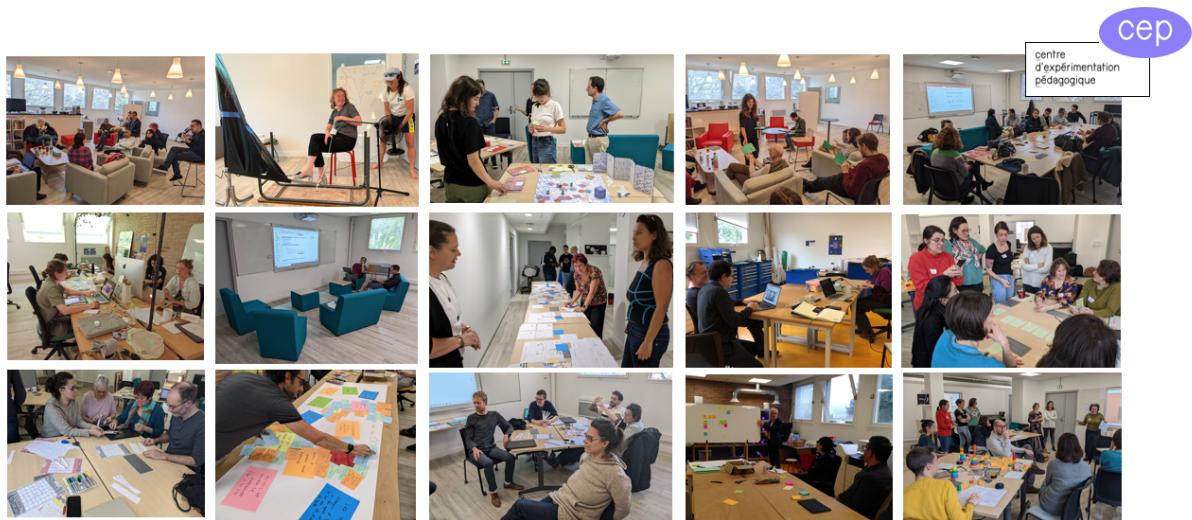
Figure 1. Le Centre d'expérimentation pédagogique de l'Institut Villebon-Georges Charpak.

Parmi les activités régulièrement proposées et qui permettent de soutenir la dynamique collective, nous pouvons citer des temps de formations (e.g. formation aux statistiques ; à la conduite d'entretien ; à la métacognition), des retraites de rédaction, des temps d'échange pédagogiques ou encore des rencontres « Journal Club » de partage bibliographique.