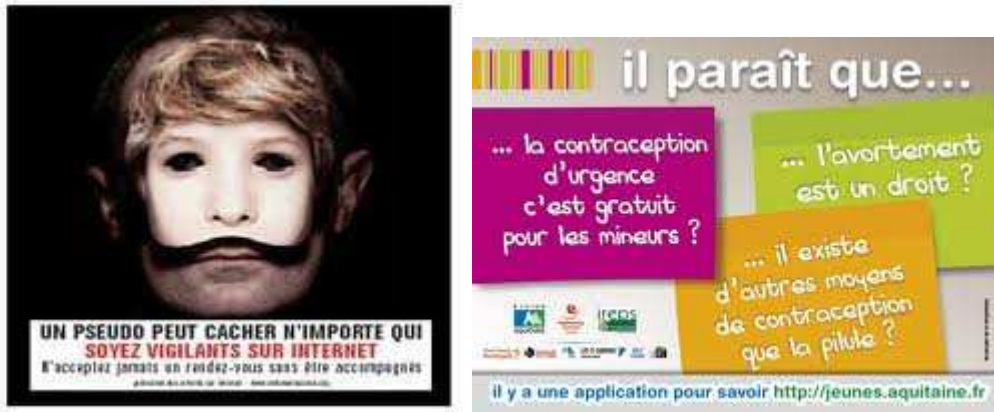
AFFICHES DE DIFFERENTES CAMPAGNES DE PREVENTION.

Constitutivement, il s'agit de mettre en scène des idées et des représentations collectives. En réalité, ces représentations sont des objets de simulacres en séries, c'est-à-dire que le circuit public qu'elles intègrent via la diffusion médiatique est un préalable, c'est une donnée première, un champ initial qui n'exige aucune justification. La sécurité routière, le sida, le cancer du sein, les abus sur internet, les grossesses non désirées, les violences conjugales, le monoxyde de carbone, les risques solaires, le tabac, le cannabis, l'alcool, le téléphone au volant, le suicide, la pollution, l'homophobie, le piratage sur internet, les maladies professionnelles, etc. ne forment pas une chaîne thématique graduelle, mais préexistent bel et bien dans la société en tant que réalités concrètes, signalées par le caractère majoritairement dangereux qu'elles enferment et qu'elles connotent.