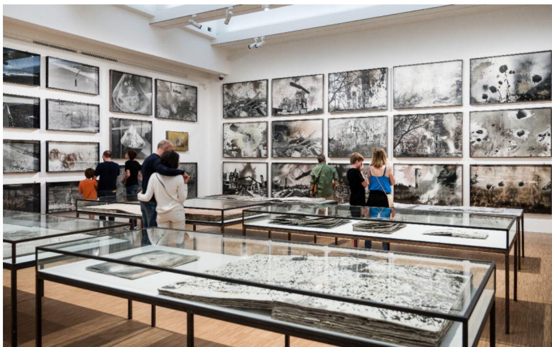
Vue de l'exposition Anselm Kiefer, la photographie au commencement, au LaM. Salle 3.