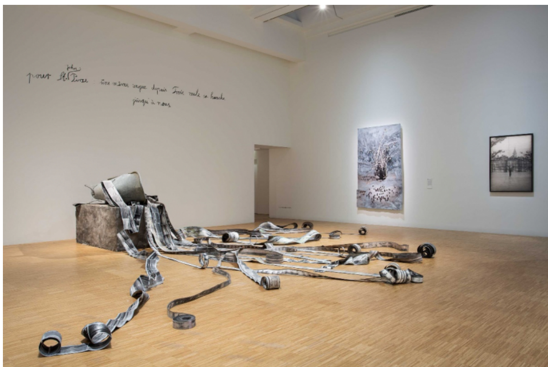
Anselm Kiefer, pour Saint-John Pierce – une même vague depuis Troie roule sa hanche jusqu'à nous, 2023, plomb, acier, photographies.

© Anselm Kiefer.