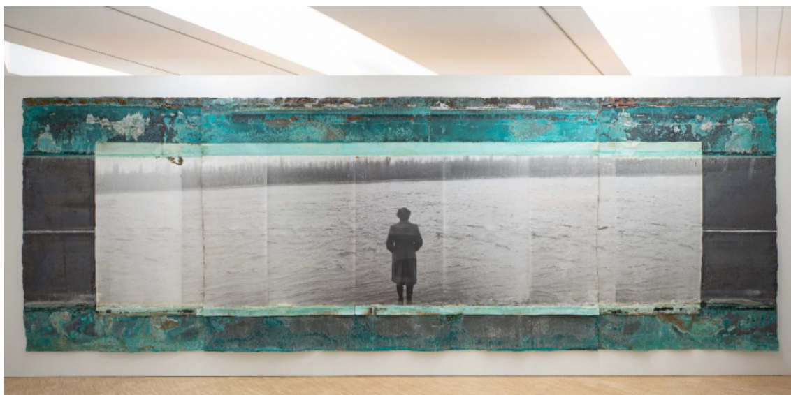
Anselm Kiefer, Der Rhein [Le Rhin] , 1969-2012, Électrolyse sur tirage photographique monté sur plomb, 380 × 1 100 cm

© Anselm Kiefer.