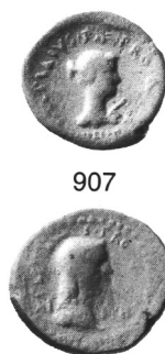
Fig. 4. Série au nom de P. Lepidius (numéros RPC).

Nous proposons de situer entre 31 et 27 la frappe de la série au nom de P. Lepidius (fig. 4) car elle semble bien aboutie dans sa conception