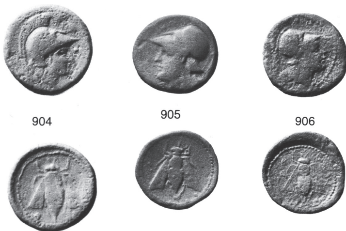
Fig. 1. Série Rome/Abeille (numéros RPC).

M. Asolati suppose dans une étude récente qu'il aurait été frappé en Cyrénaïque car la plupart des exemplaires connus y ont été découverts 36 . Les chercheurs ont toutefois longtemps pensé que l'atelier se trouvait en Crète à cause de l'iconographie 37 . En effet, le