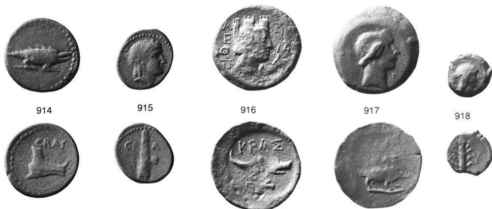
Fig. 3. Série au nom de Crassus (numéros RPC).

Dionysos qui apparaît sur la plus grande dénomination. A. Chapman a repris cette datation 50 . Le fait que le buste d'Artémis du monnayage latin de L. Lollius soit similaire stylistiquement à celui qui figure au droit de certaines monnaies de Cnossos pourrait indiquer qu'ils sont contemporains ou que les bronzes de Cnossos suivent de près les monnaies communes 51 . En effet, la proximité stylistique est telle que l'on peut supposer qu'un même artisan a gravé les coins ou bien qu'un graveur s'est inspiré de l'une des monnaies pour graver le coin destiné à l'autre monnayage. Les deux séries ont dû circuler à la même période. Le monnayage de Cnossos est forcément postérieur à 36 ou 27, dates supposées de la fondation de la colonie, mais celui de la double province peut tout à fait être bien antérieur, mais circuler encore en 36 ou en 27. Pour M. Grant un monnayage portant la marque du pouvoir romain, mais pas de titulature officielle, serait incorrect dans une province, mais acceptable sur une terre royale. Il propose donc de situer le monnayage entre la date d'acquisition de la province par