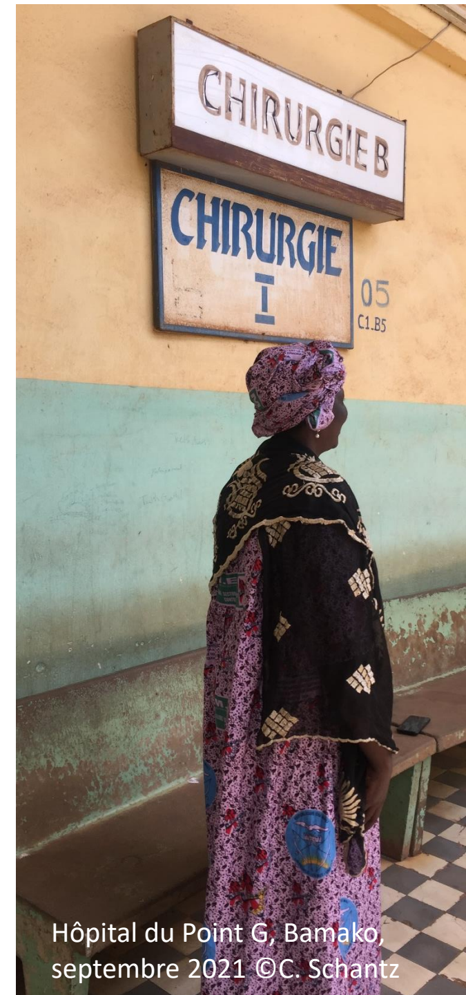
Hôpital du Point G, Bamako, septembre 2021