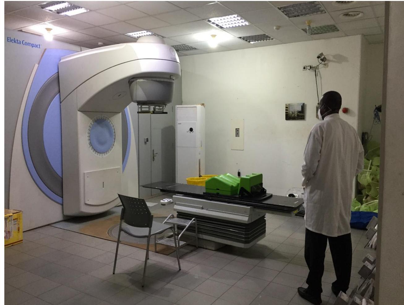
L'unique appareil de radiothérapie du Mali, Septembre 2021