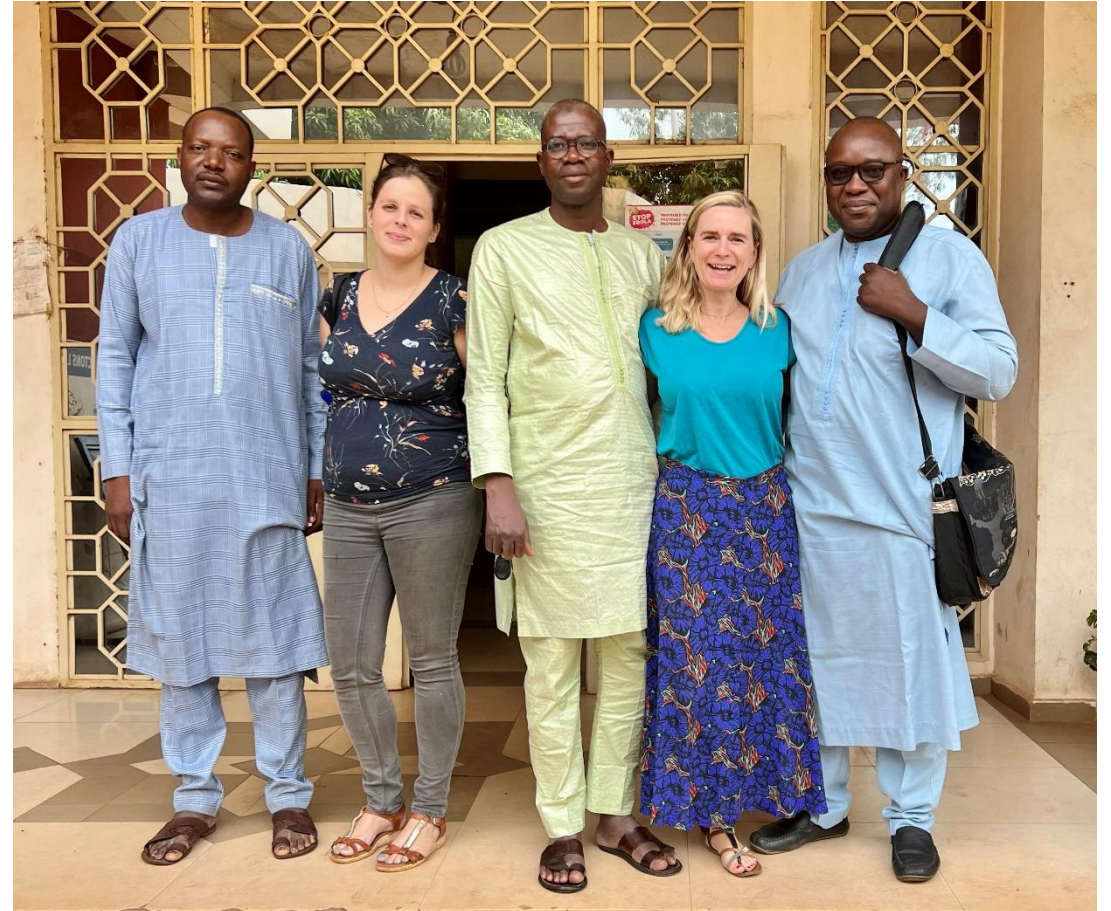
Bamako, juillet 2022