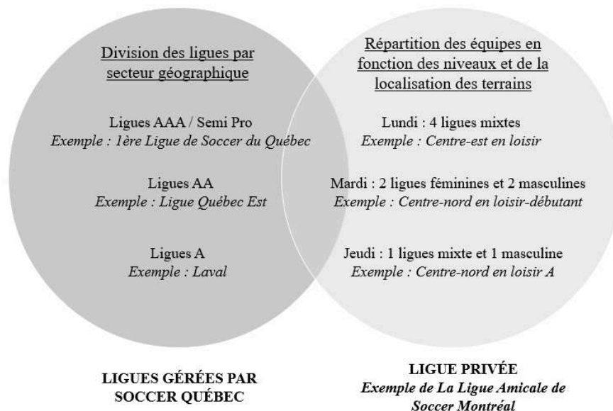
Figure 1 – Exemple de l'organisation d'une saison estivale (2022) par Soccer Québec et une ligue privée (LASM)