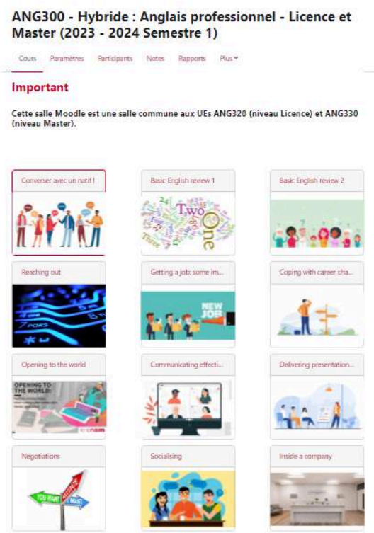
Figure 3. Exemple de ressources numériques à visée professionnalisante disponibles sur la plateforme Moodle du Cnam