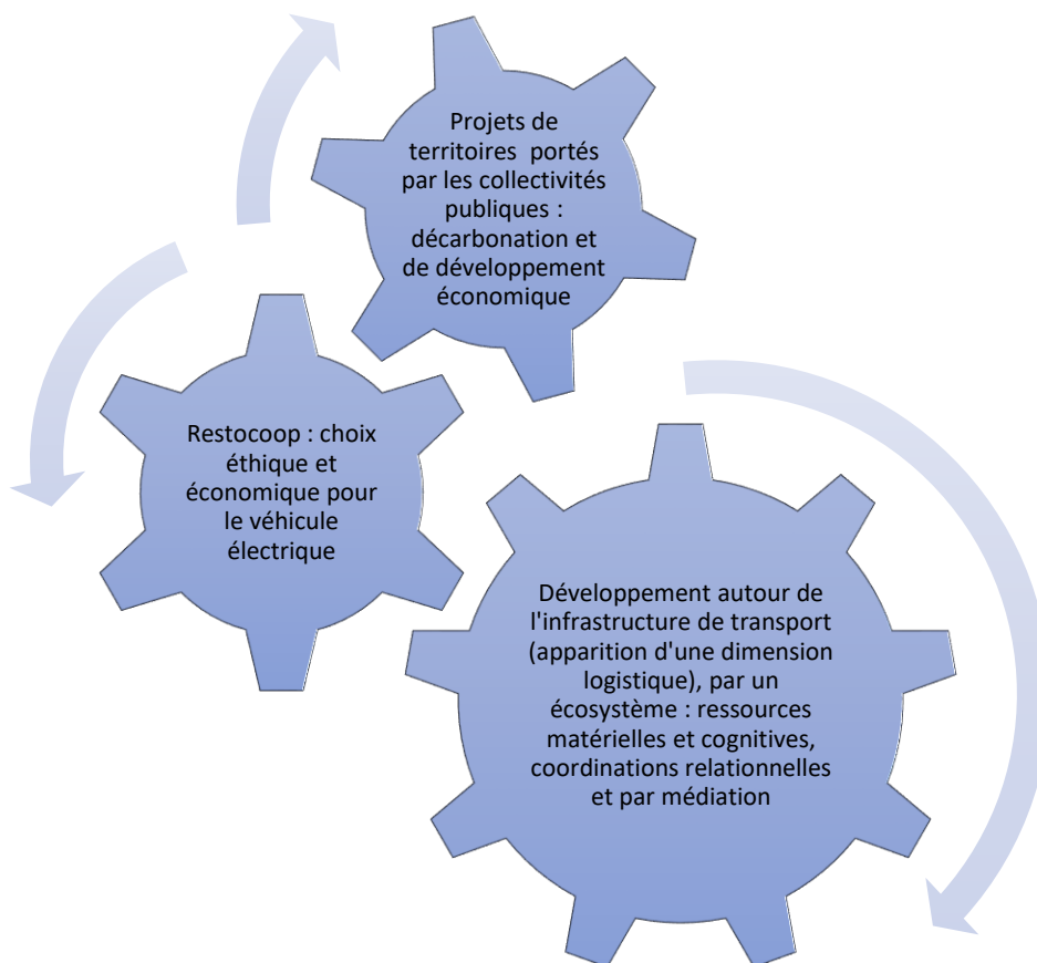
Figure 6 Représentation du mécanisme menant au projet logistique de Restocoop.