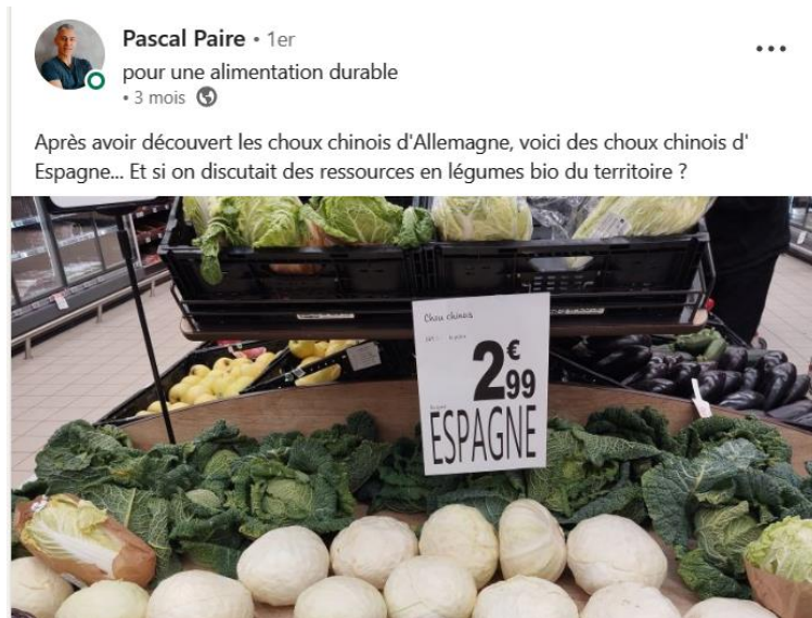
Figure 3 Publication LinkedIn, Pascal Paire, 2024. Le contenu de la publication montre un engagement personnel dans la qualité de l'approvisionnement selon l'origine géographique, supposant une compréhension des problématiques d'empreinte carbone et de souveraineté alimentaire dans les territoires. La forme de cette publication reflète également une capacité à utiliser les réseaux sociaux (maîtrise de l'image et du discours).