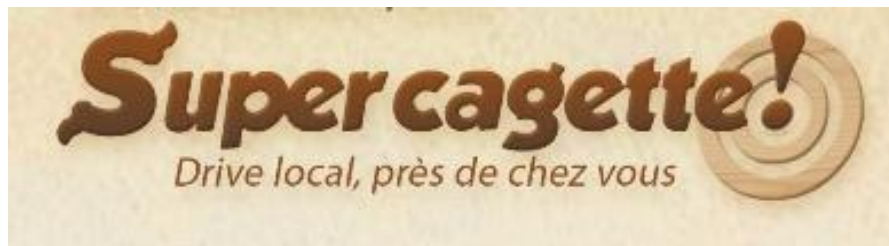
Figure 1 Logo de Supercagette, 2013