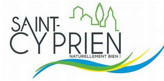
Figure 7 Logo de la commune de Saint-Cyprien (42), 2421 habitants (2021), Loire Forez Agglomération.

De ces constats, il apparaît que le moyen de transport, initialement représenté par le fourgon électrique, trouve des continuités par l'inventivité d'un individu et les capacités d'innovation de l'écosystème. Il y a fort à croire que l'incertitude générée par l'énergie électrique en zone rurale, couplée à des facteurs personnels de motivation (financement, concrétisation du projet, réduction supposée des charges d'exploitation, etc.), conduisent à ce genre de dynamique. A partir des ressources disponibles et des relations préétablies ou en émergence, une infrastructure, « ensemble d'installations, d'équipements nécessaires à une collectivité » (Larousse, 2024) ou « ensemble des équipements économiques ou techniques » (LeRobert, 2024), se construit autour du véhicule électrique, des systèmes de recharge électrique, et des outils conçus spécifiquement ou mobilisés de manière particulière (mode de chargement, SI, etc.). Les systèmes de valeurs eux-mêmes semblent pouvoir être interrogés comme infrastructure, à partir d'une acception élargie (G. Allaire, 2014).