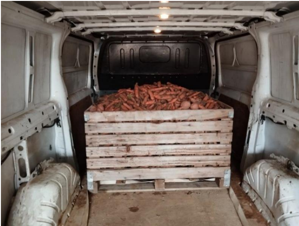
Figure 8 Chargement du véhicule en carottes bio, Pascal Paire, 2024