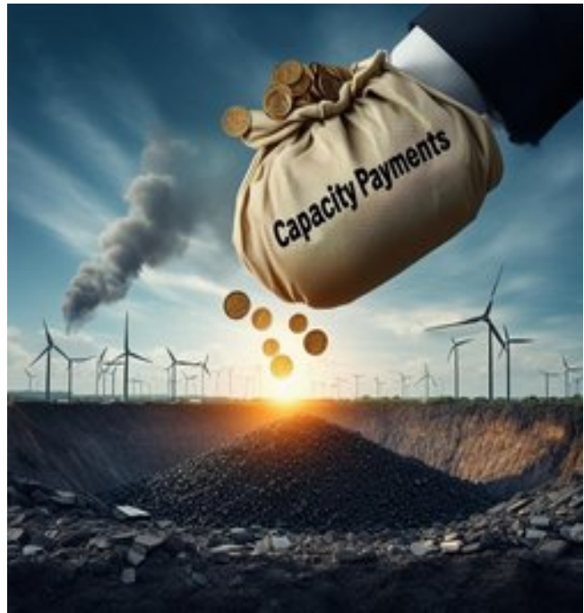
Figure 1: After document 118.

Thứ hai, nó chỉ áp dụng cho các nhà máy điện than. Một cách tiếp cận công bằng với các công nghệ sẽ có hiệu quả kinh tế tốt hơn. Than không phải là lựa chọn duy nhất để bổ khuyết điện gió và điện mặt trời khi hai dạng năng lượng này không hoạt động. Trong báo cáo Thị trường Công suất Vương quốc Anh 2022-2023, phần lớn điện năng bổ khuyết tới từ điện khí, kế tiếp đó là điện khí liên châu Âu, và cuối cùng là pin lưu trữ hoặc thủy điện tích năng. Những lựa chọn khác nữa bao gồm Mô hình phát điện Phân tán (phát điện quy mô nhỏ, gần nơi tiêu thụ điện năng), Sử dụng điện hiệu quả, Chương trình Điều chỉnh phụ tải điện (chủ động điều chỉnh nhu cầu tiêu thụ điện của khách hàng trong thời điểm cụ thể để giảm áp lực lên hệ thống). Chẳng hạn, đối diện với nhu cầu điện cao điểm vào hè năm nay, EVN đã tăng công suất của mình bằng cách vay máy phát điện diesel từ các khách hàng của mình và ký thỏa thuận với hàng chục các đối tác công nghiệp để họ giảm nhu cầu dùng điện.