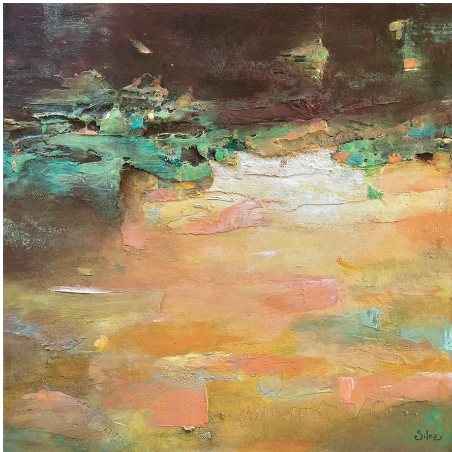
Silvain VERNAZ, Le seuil de la répression