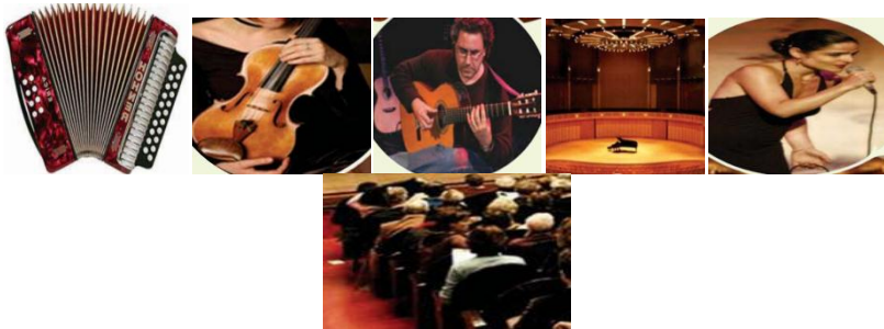
Figure 04 : Images variées du manuel

Consigne 01 : faites correspondre à chaque image un mot de la liste suivante : une scène - un guitariste - un accordéon - une chanteuse - un violon - le public.