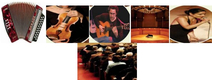
Figure 04 + 05 : Manuel de la 9 ème année de base, p. 194, 202, 205