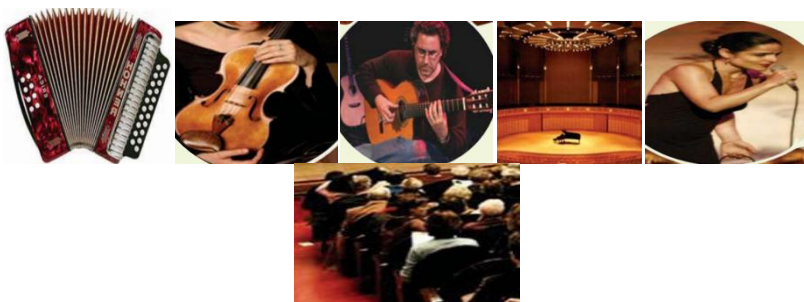
Figure 05 : Images variées du manuel

Consigne 02 : en vous appuyant sur la liste des mots donnée, décrivez oralement les images proposées en relation avec la thématique du module