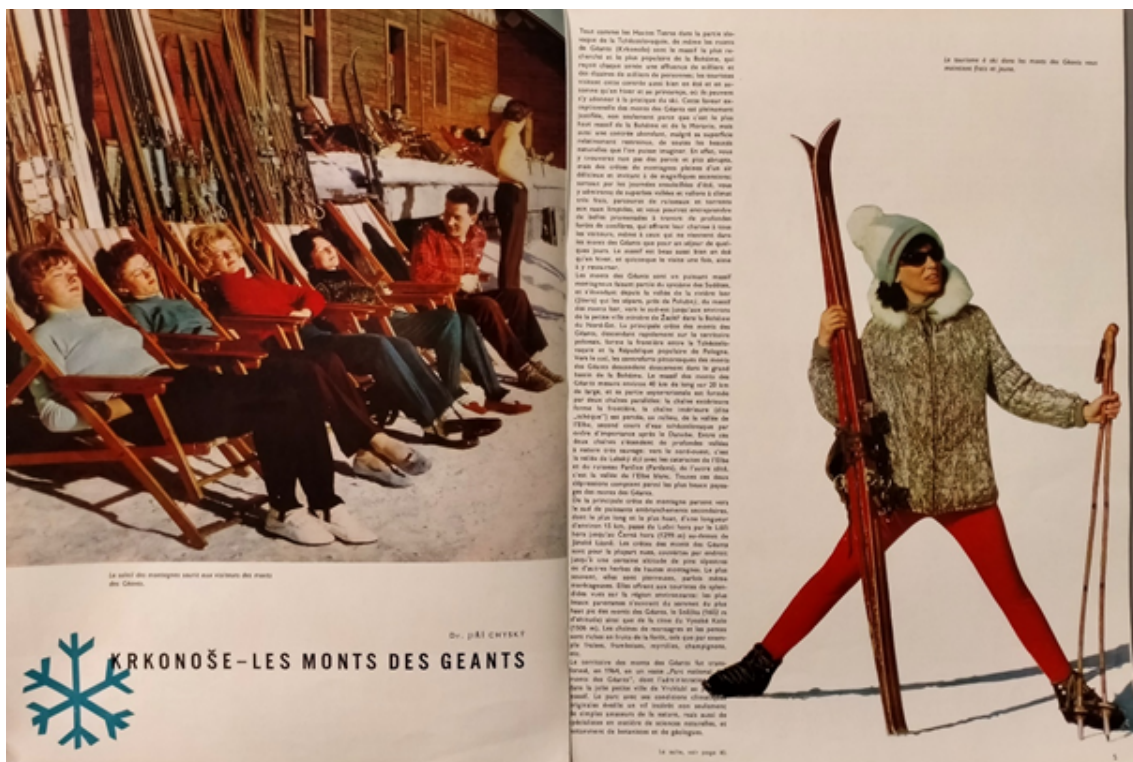
« Krkonoše – Monts des géants », Jiří Chyský, Soyez les bienvenus en Tchécoslovaquie , 01/1966, p. 4-5, Bibliothèque du Tourisme et des Voyages, Paris, cote TCH 21