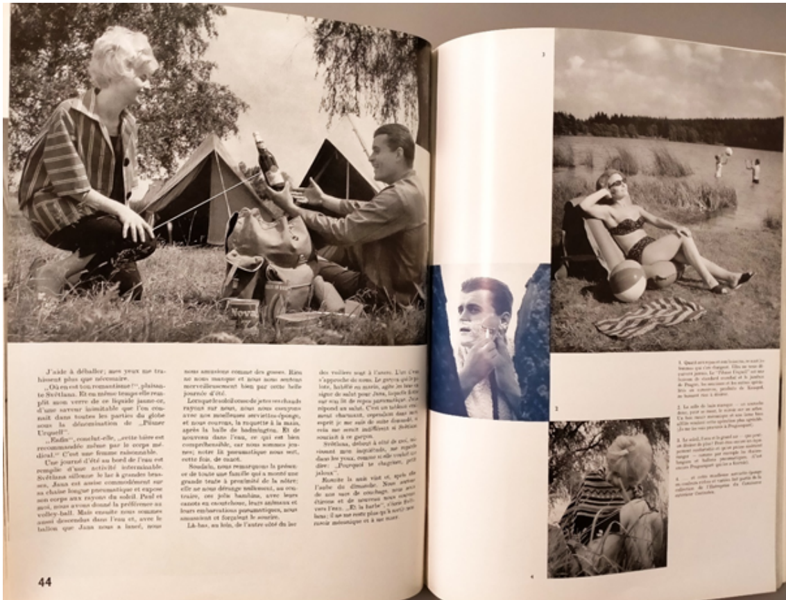
« À trente kilomètres de Prague », Jiří Mečtář, Pour vous de Tchécoslovaquie , 01/1962, p. 44-45, Bibliothèque du Tourisme et des Voyages, Paris, cote TCH 20.