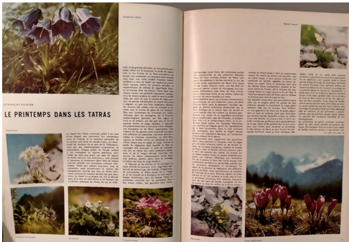
« Le printemps dans les Tatras », Stanislav Richter, Soyez les bienvenus en Tchécoslovaquie , 1/1968, p. 16-17, Bibliothèque du Tourisme et des Voyages, Paris, cote TCH 21