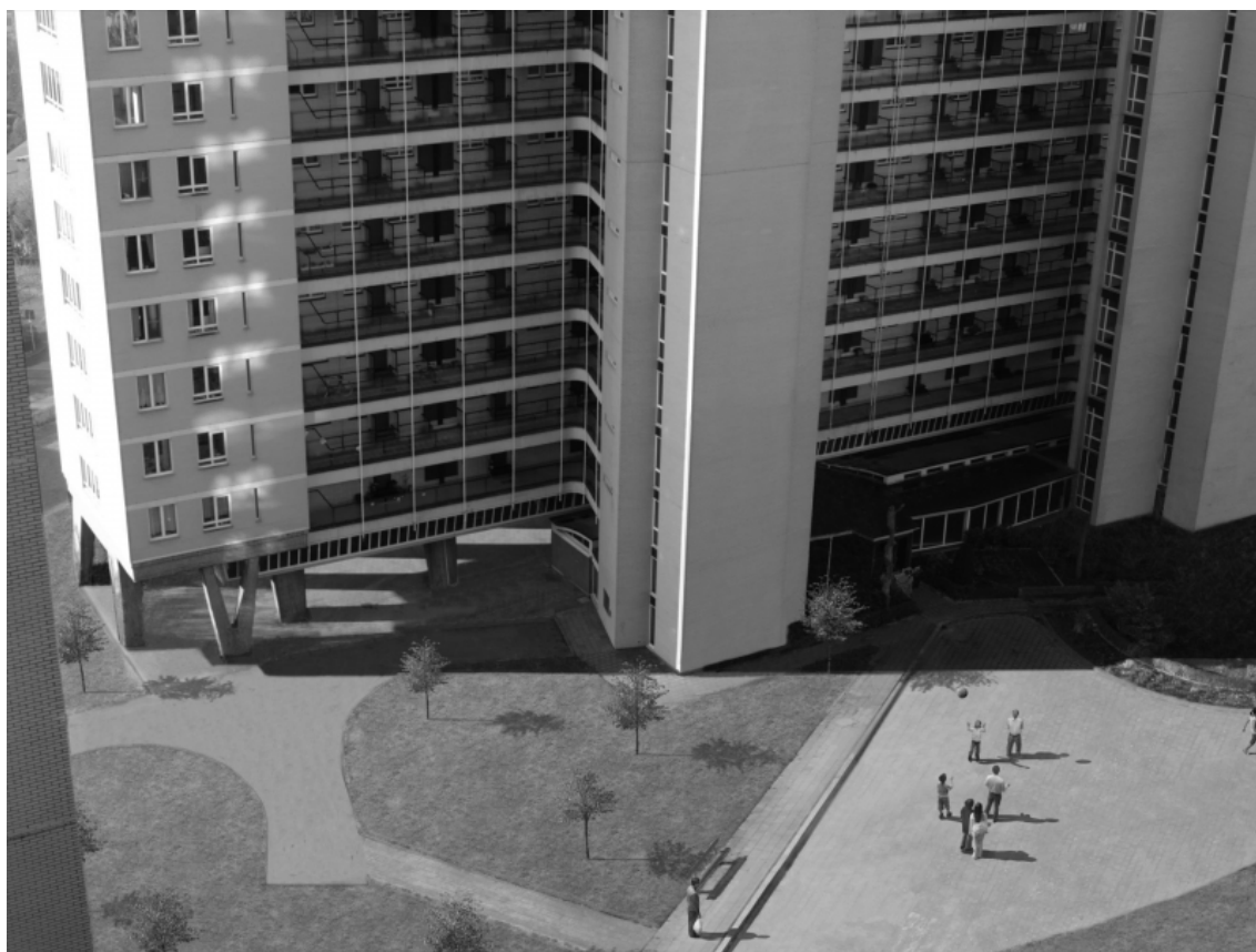
David Claerbout, Sections of a Happy Moment , 2007, projection vidéo, noir et blanc, stéréo audio, 25 min 57 en boucle.