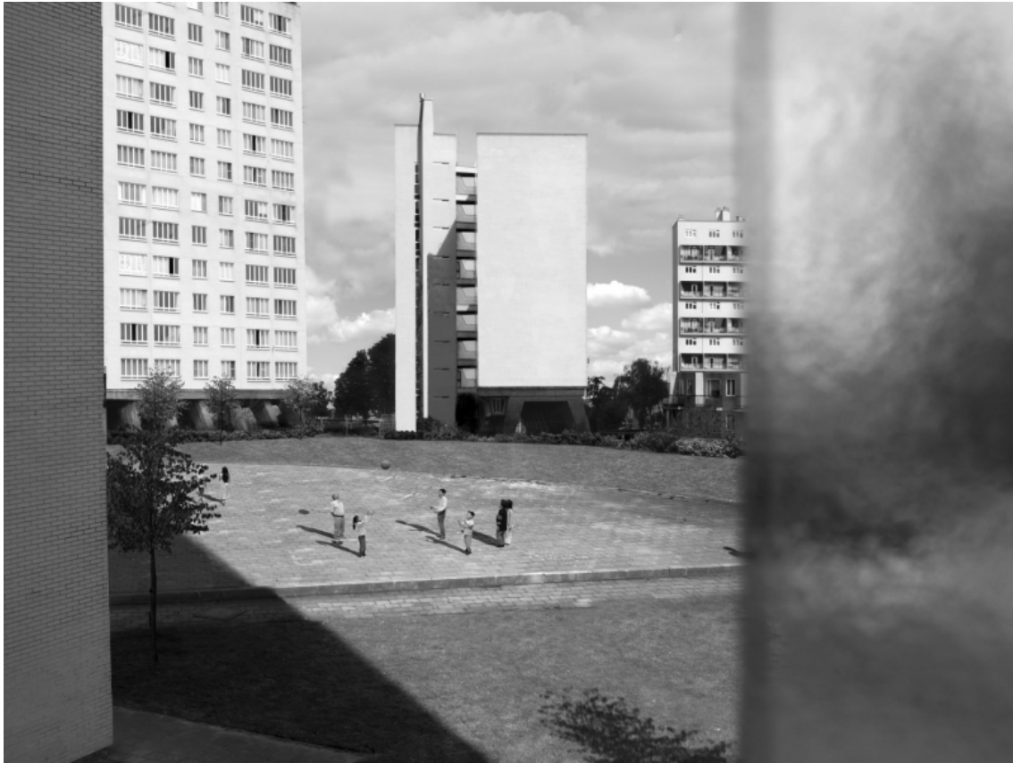
David Claerbout, Sections of a Happy Moment , 2007, projection vidéo, noir et blanc, stéréo audio, 25 min 57 en boucle.