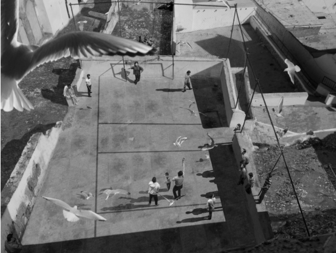
David Claerbout, The Algiers' Sections of a Happy Moment , 2008, projection vidéo, noir et blanc, stéréo audio, 37 min en boucle.