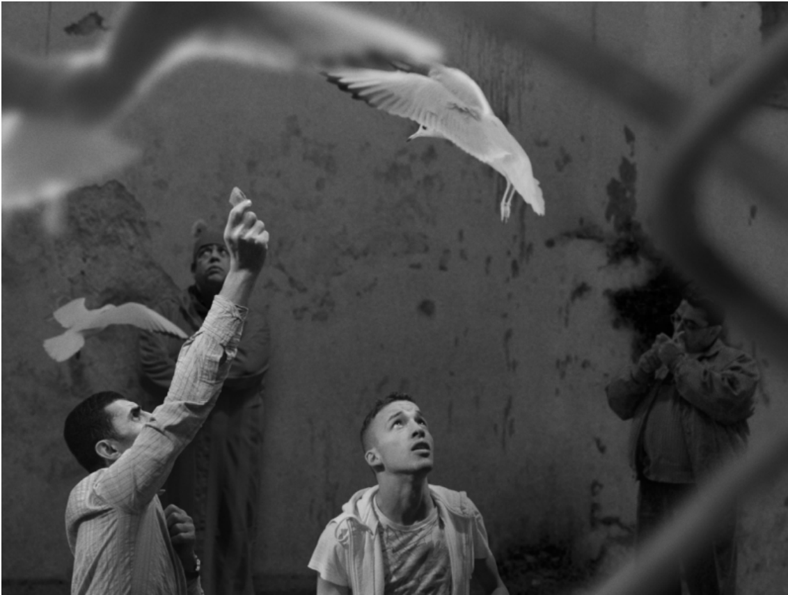
David Claerbout, The Algiers' Sections of a Happy Moment , 2008, projection vidéo, noir et blanc, stéréo audio, 37 min en boucle.