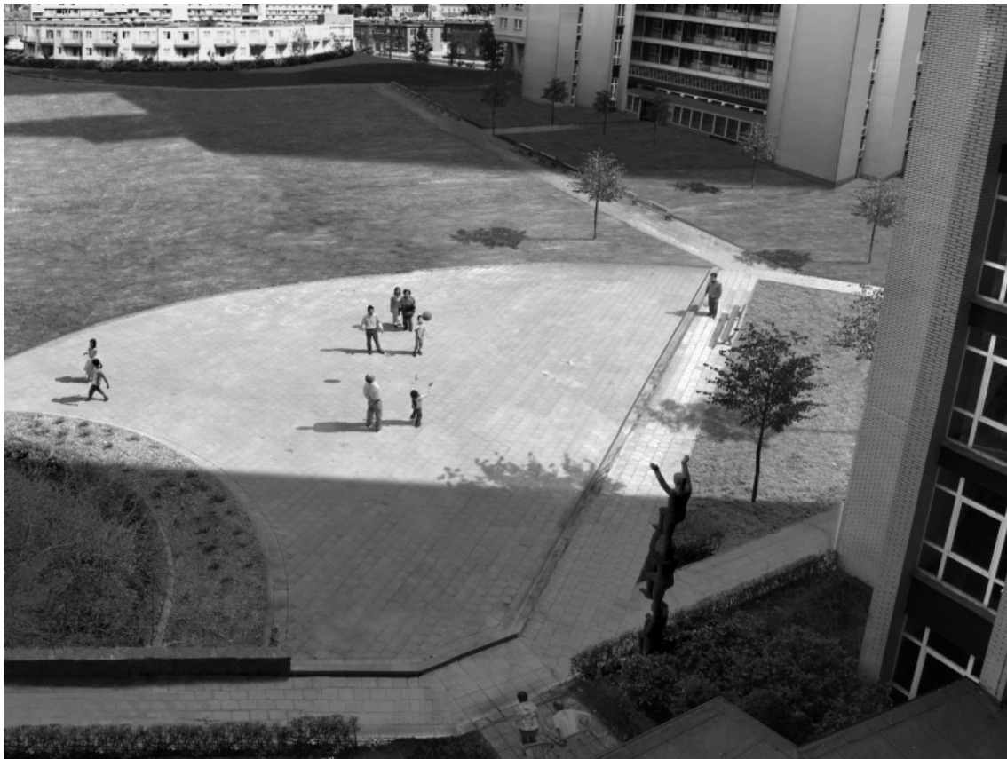
David Claerbout, Sections of a Happy Moment , 2007, projection vidéo, noir et blanc, stéréo audio, 25 min 57 en boucle.