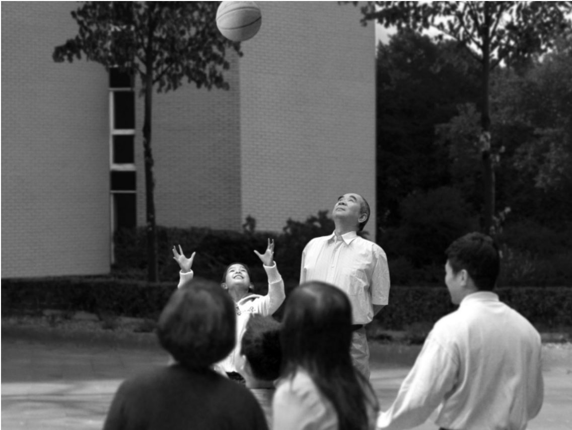
David Claerbout, Sections of a Happy Moment , 2007, projection vidéo, noir et blanc, stéréo audio, 25 min 57 en boucle.