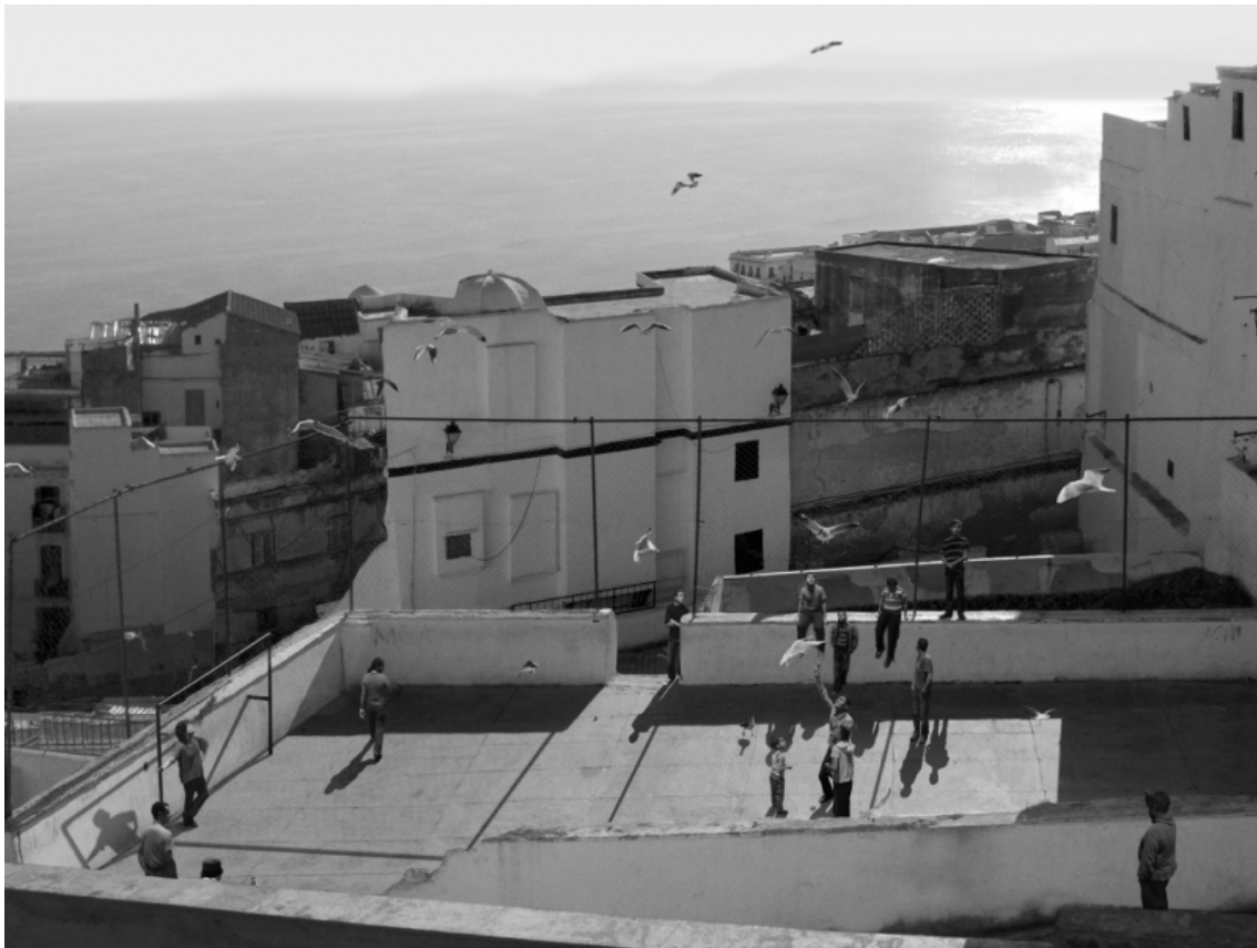
David Claerbout, The Algiers' Sections of a Happy Moment , 2008, projection vidéo, noir et blanc, stéréo audio, 37 min en boucle.