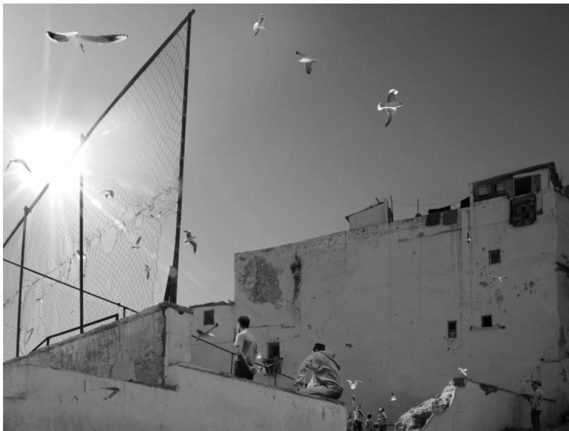
David Claerbout, The Algiers' Sections of a Happy Moment , 2008, projection vidéo, noir et blanc, stéréo audio, 37 min en boucle.